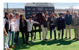
El equipo de Scuderia Dreams Road y Magic Warrior.

“Gente que lleva mucho tiempo en las carreras con mucha experiencia siempre me decían que hay que cuidar mucho a los tres años para que maduren bien y es lo que hemos hecho con Magic Warrior. Le hemos cuidado mucho, está más fuerte y es más caballo, y hoy hemos tenido la respuesta del caballo con una victoria al 70% de su forma”.