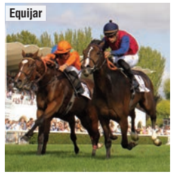
War of Dance (naranja), segunda de Kowalsky.

Los tres años con más valor, según el Jockey Club, del preparador donostiarra adelantan su reaparición el próximo domingo en lugar de esperar a los premios Torre Arias y Atlántida , las previas clásicas de las Poules . Farnesio destaca en el Savater y War of Dance tiene todo para salir de maiden en el Villablanca . No sólo aspiran a coronarse en la milla, sino también a liderar en dos curvas, pues el macho además está inscrito en el Derby y la hembra en el Oaks .