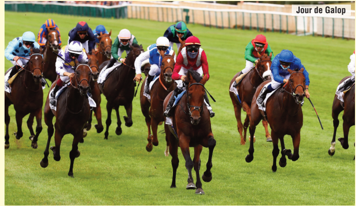
A la izquierda, con los colores de Antonio Caro, octavo del derby francés de Mishriff.

Selección: Fantastic Spirit Alternativa: Naranco