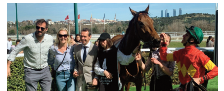
Adaaylight Dancer, de Mad Men y con Saccu, cerró el cuarteto de Arizkorreta.

Janácek lidera y Gelabert sube al cuarto puesto