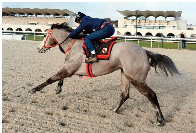
Belador, siempre bien.