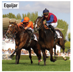
War of Dance (naranja), segunda de Kowalsky.

Los tres años con más valor, según el Jockey Club , del preparador donostiarra adelantan su reaparición el próximo domingo en lugar de esperar a los premios Torre Arias y Atlántida , las previas clásicas de las Poules . Farnesio destaca en el Savater y War of Dance tiene todo para salir de maiden en el Villablanca . No sólo aspiran a coronarse en la milla, sino también a liderar en dos curvas, pues el macho además está inscrito en el Derby y la hembra en el Oaks .