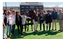
El equipo de Scuderia Dreams Road y Magic Warrior.

“Gente que lleva mucho tiempo en las carreras con mucha experiencia siempre me decían que hay que cuidar mucho a los tres años para que maduren bien y es lo que hemos hecho con Magic Warrior. Le hemos cuidado mucho, está más fuerte y es más caballo, y hoy hemos tenido la respuesta del caballo con una victoria al 70% de su forma”.