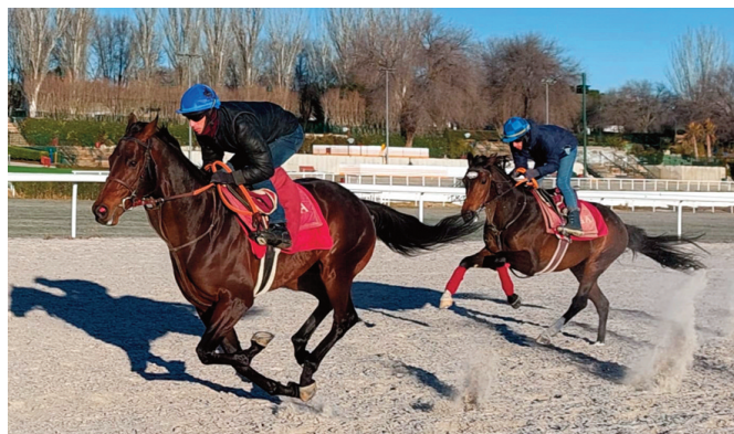
Naranco y Amtiyaz, dos de Rocío.