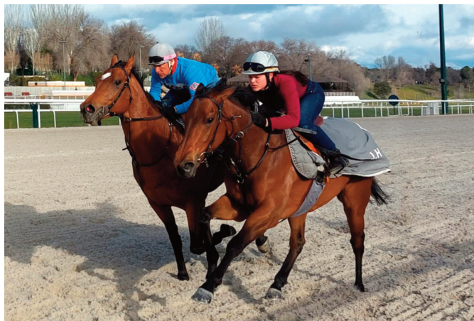
The Hint y Pretty Emerald (primer plano).