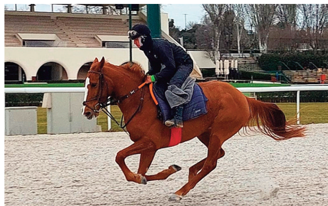
Hardpia, afinando en solitario.