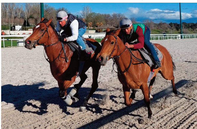
The Hint (Horcajada) y Cham's Pride.