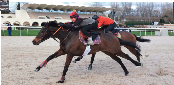
Bailén y Aretha en primer plano.

• War of Dance , Grazalema y Rock Moon no establecían diferencias: 1'08"24, 42"73 y 33"17. Cómodas. Rock Moon tiene muchas papeletas para ganar el Manola. Madre galopadora con fondo y barro. Acompañar