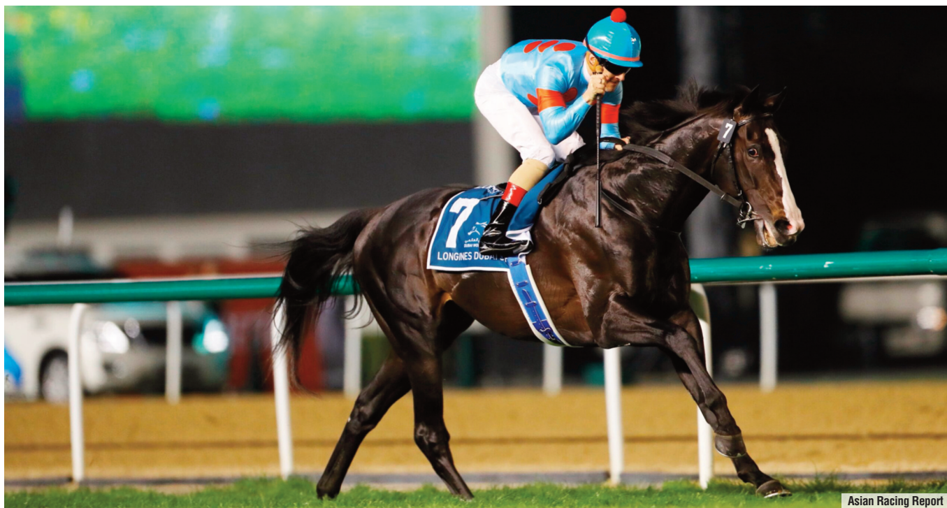
Asian Racing Report