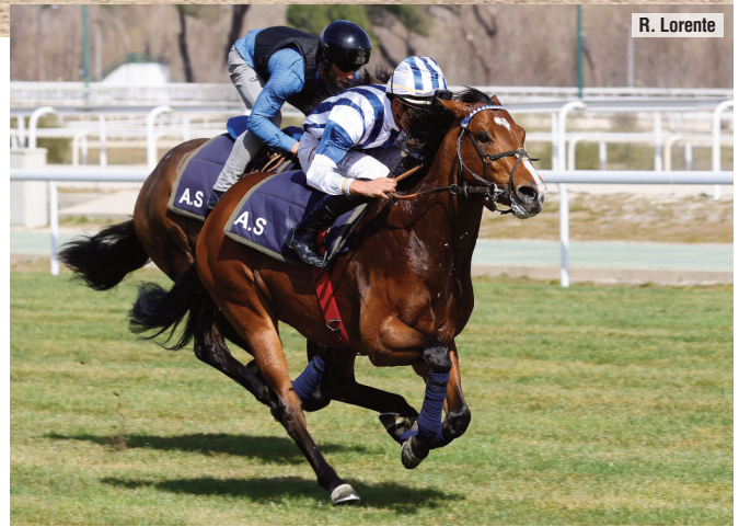
Disillusion, galopando tras las carreras del domingo 12.

• No era exigido este sábado Disillusion para marcar 1'09"95, 43"68 y 32"73. Sin forzar. Dejó muy buenas sensaciones en su trabajo en hierba semanas atrás. Cambia de rit-