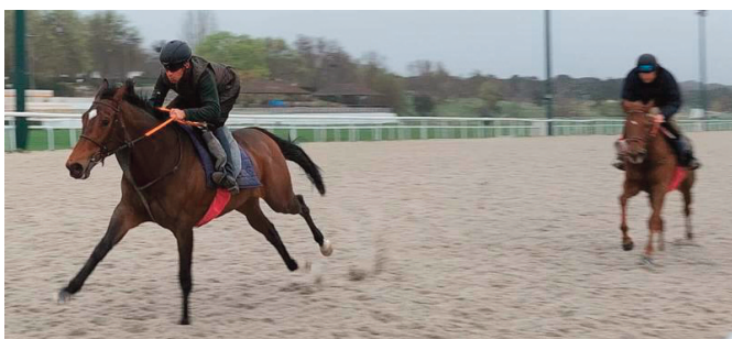
Love for Life domina a Halagada.