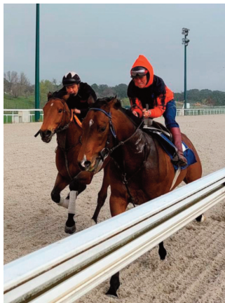
Mahatma (exterior) y Conspiracy por delante.

• No era exigido este sábado Disillusion para marcar 1'09"95, 43"68 y 32"73. Sin forzar. Dejó muy buenas sensaciones en su trabajo en hierba semanas atrás. Cambia de rit-