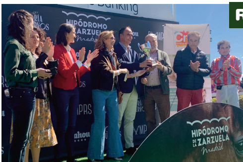
La ministra de Industria, Comercio y Turismo, Reyes Maroto, entregó el trofeo ganado por Resacón.