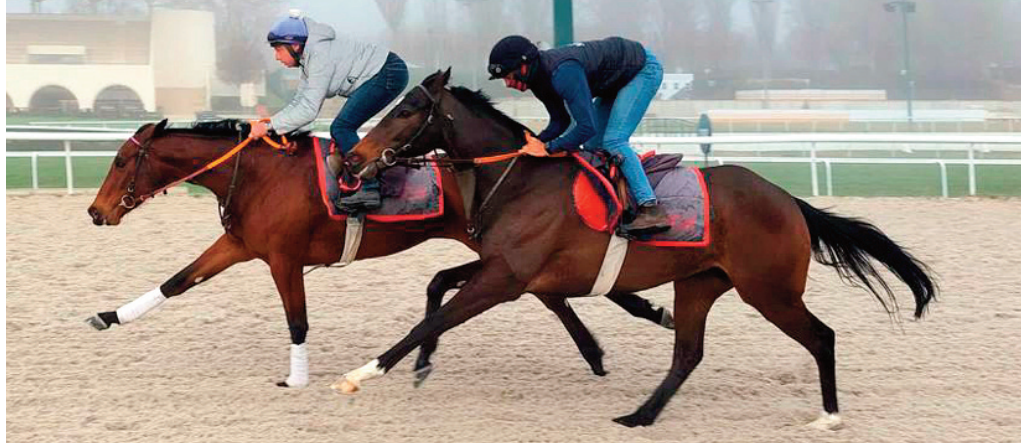
Sommersun vino sobre Peken.

• Queen of Glory (C. Pérez) era algo más movida que Artsvelt : 1'07"77, 42"81 y 32"92. Bien.