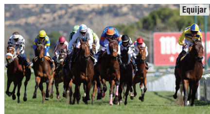
Super Lover, por delante, y Tazones por el centro, gemela del Eduardo Torroja.