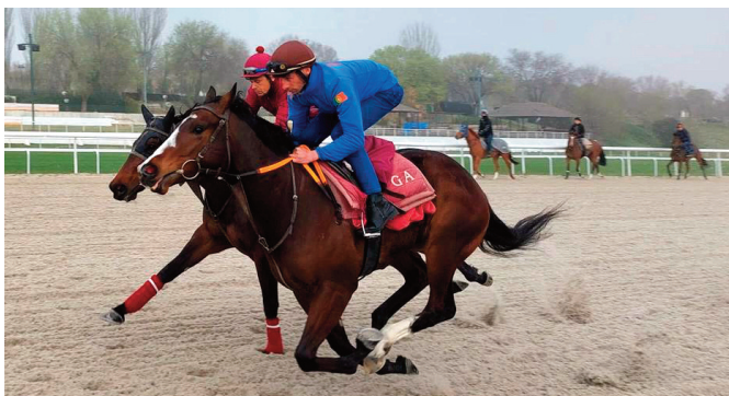
Madrid (primer plano) y Empel, de Arizkorreta.

• Mantenimiento en solitario de Defined : 41"92 y 32"29. Gustó. Tritón (B. Valentí) marcaba de menos a más: 1'07"49, 42"32 y 32"89. Buen perfil para destacar en San Sebastián.