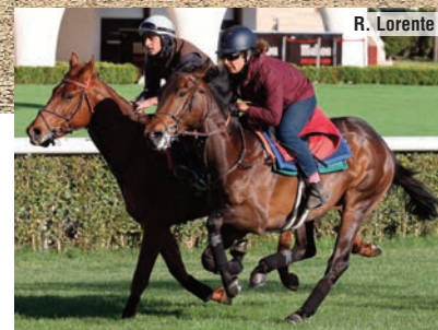
Crayon en primer plano y Joker, de Valentí.