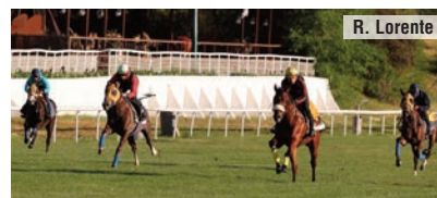
Trampas y Pashmina se ejercitan para Arguinzones.