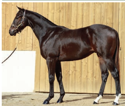
Macho por City Light de Ímaz, su única compra en subasta.