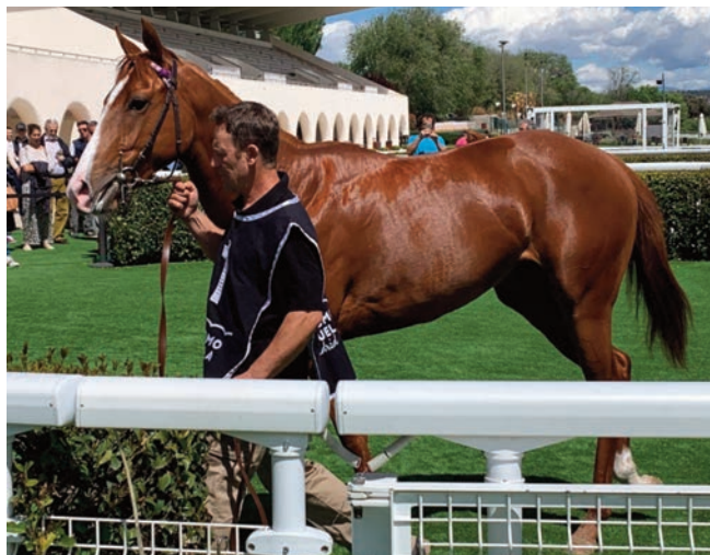
Farah en la subasta del pasado sábado.