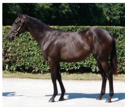
Le Havre y Treasure, una joya de 145.000 euros para Avial.