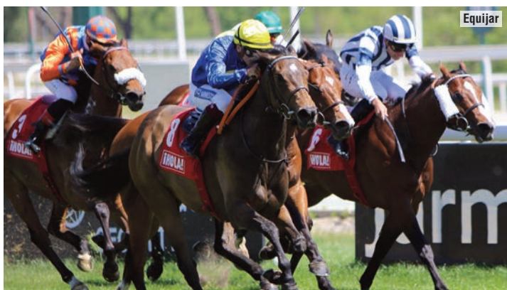
Azul resolvió la pelea interior en la línea recta.