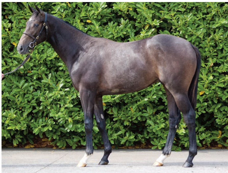
Study Man y Cosmic Fire, un tordo de 50.000 euros procedente de Goffs para Rocío.