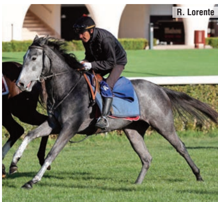
Dulces Sueños, por Barrera y de Martín Vidania.