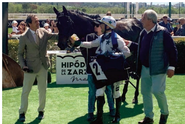
Furioso volvió a ganar para el equipo de Rocío.