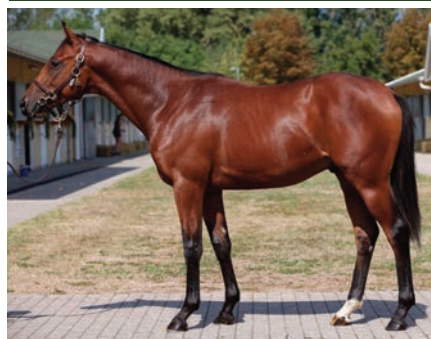
Potro por Adlerflug y Good Hope, por 46.000 euros en BBAG, para Soto.