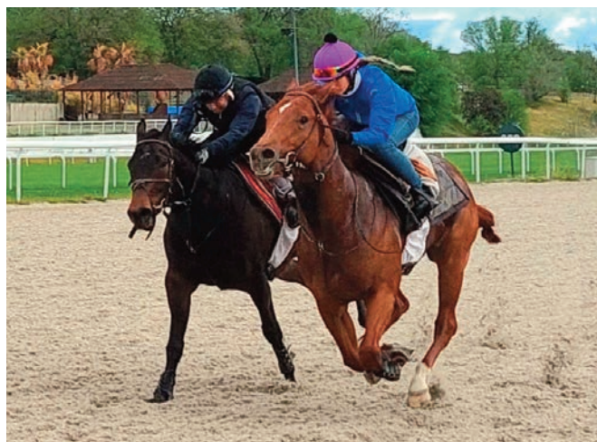
Ejercicio de Araka la Kana y Marcolini.