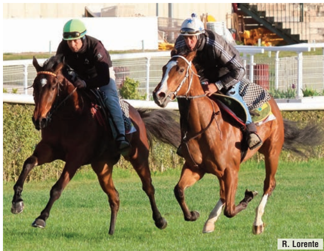
Messina (carena) y Princess Chloe.