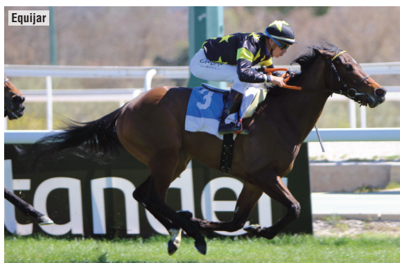
Sophie's Watch y Valle en el Atlántida.