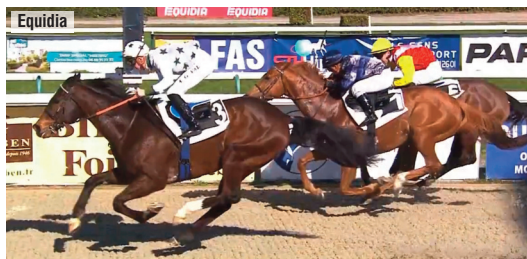
El segundo triunfo de 2023 en Pau de Blackberry.