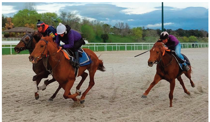
Lady Razalma por el exterior, con Bopper y Trapío.