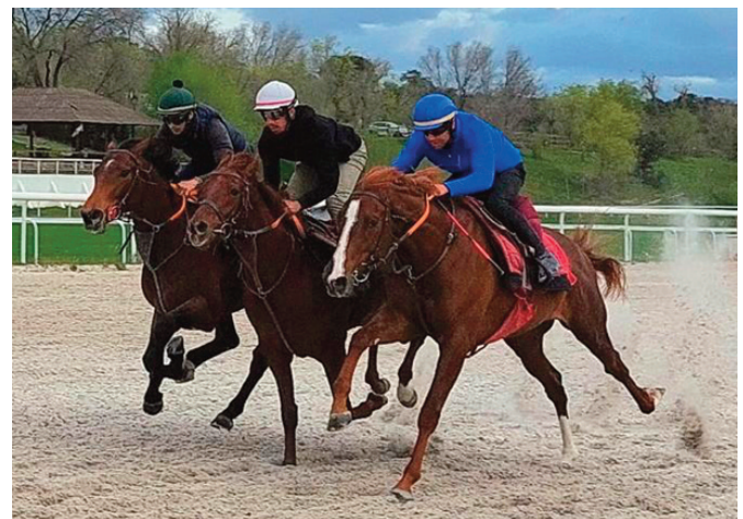
Pamplona (en primer plano) con Warrior's Revenge y Farnesio.