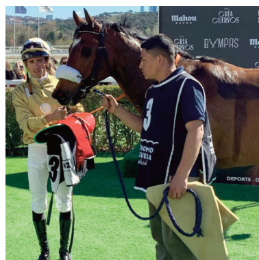
Telemachus abrió el triplete de Sousa.