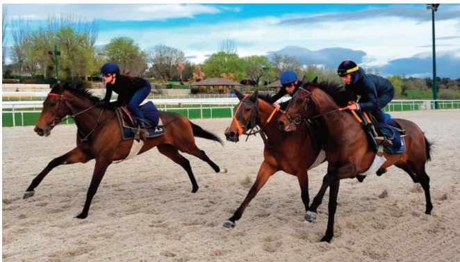
Flaming Glass (exterior) y Dream de Sercam de guía.