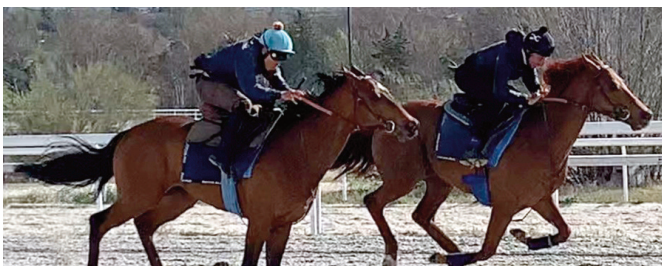
The Game por delante de Faith Rose.