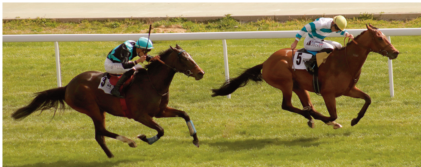
Faith Rose por delante de Safaga, la gemela de la preparatoria del Gran Premio Nacional.

“Estamos de nuevo en la casilla de salida, y esto demanda acciones de marketing para que la carrera brille en ese sitio tan incómodo del calendario. (...) El momento perfecto para inventarse algo que haga que la disputa del Gran Premio Nacional sea un eventazo del que todo el mundo quiera ser parte, de modo que todo propietario y todo profesional quiera correrlo y, más aún, ganarlo”