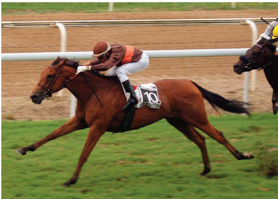
Show Gorb en el Gran Premio Milagro de 2012.