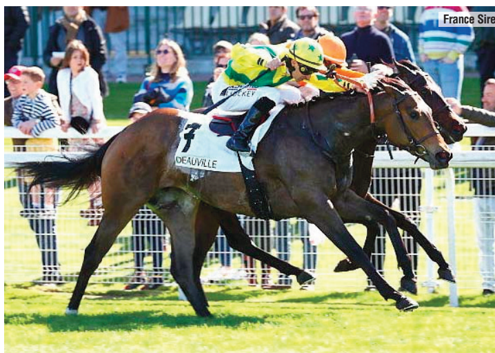
La 3 años Showay, sorpresa en el Imprudence en Deauville.