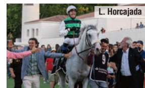
En el regreso triunfal de White King en el Villapadierna.