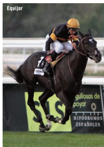
A lomos de Lordofthehorizon en el GP de Madrid 2022.

“Estoy a tope de moral, con muchas ganas de seguir trabajando y ganando carreras. De momento, no tengo fecha de caducidad”