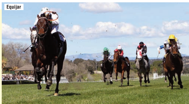
Naranco por delante de Lisicles en la preparatoria, con Fantastic Spirit en la cuerda.