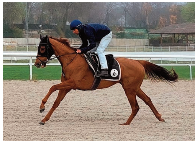
White Bay y su preparador.

anda más fino que en su presentación en Madrid y el primero es un ex Godolphin que no se mueve mal.