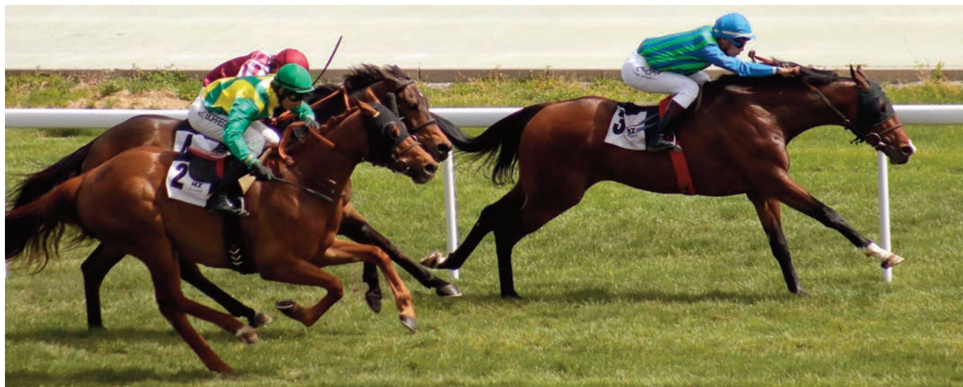
The Game (2) a punto de culminar la caza de Severus y Finely Tuned.