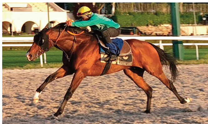
Severus, un galopador muy serio.