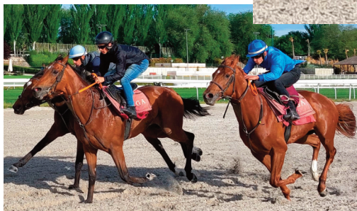
Volcán, White Wine cómodo y Defined.