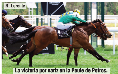
La victoria por nariz en la Poule de Potros.