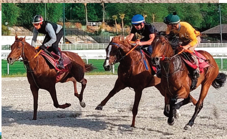
Farnesio, Warrior's Revenge con muy buen aire y Pamplona.

• Warrior's Revenge gusta un poco más que Pamplona y Farnesio . 43"36 y 33"16. Tuvo mucho mérito su victoria con 61 kilos la primera vez que abordaba 2.200. Anda fino.