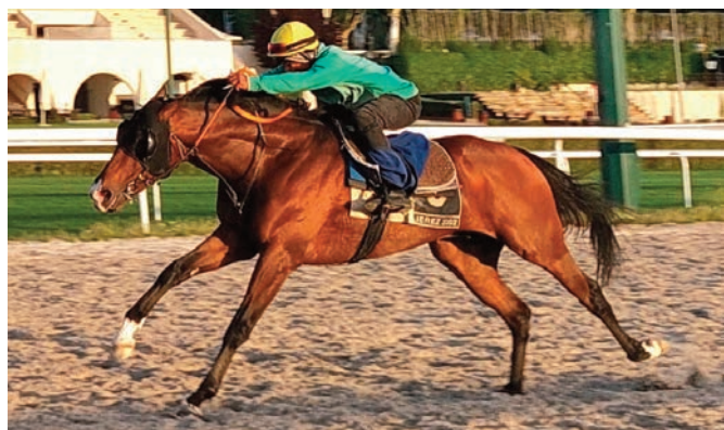
Severus, un galopador muy serio.