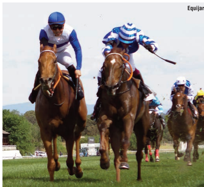
La victoria parisina de Lady Frasquita.

“Ganar con los primeros hijos de Antonella y Swift Mover es una doble satisfacción. Aunque te alegra, no es lo mismo ganar con un caballo que has comprado de yearling o de entrenamiento que con uno que has criado tú con una madre tuya; le da mucho más valor a todo”