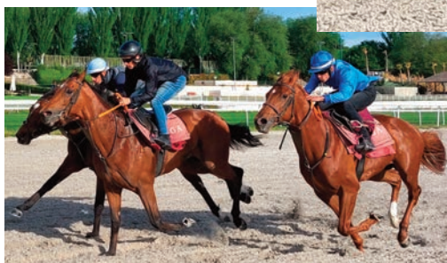
Volcán, White Wine cómodo y Defined.