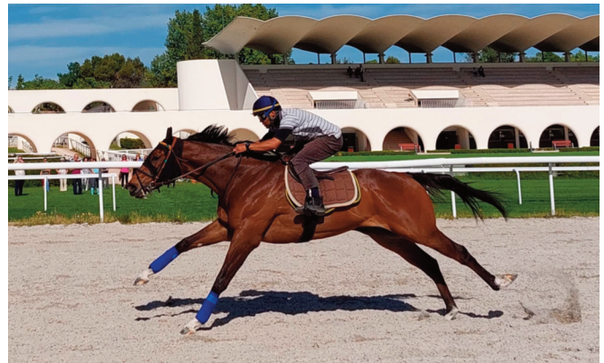
Bidul vuelve a demostrar que está en condición.