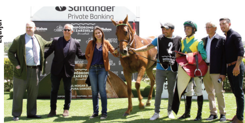
El equipo de Cielo de Madrid y Olave tras ganar el Corpa.