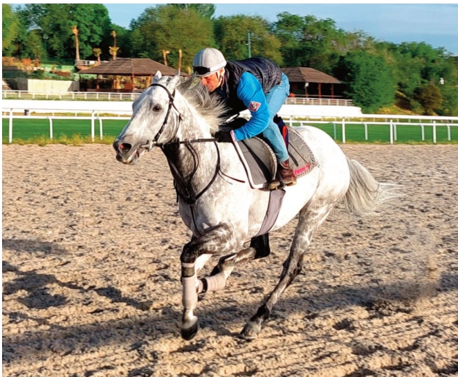
Ejercicio en corto de Speak in Colours, que pinta bien.