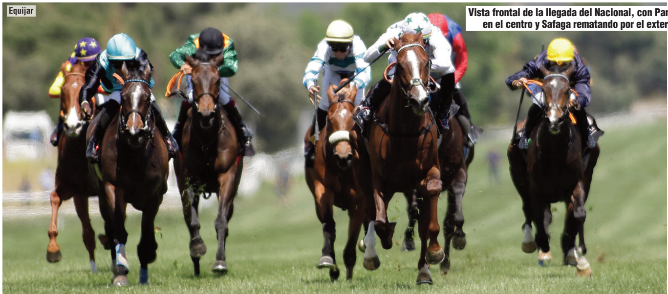
Vista frontal de la llegada del Nacional, con Pamplona en el centro y Safaga rematando por el exterior.