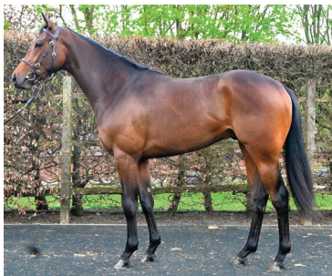
El top español, por Tamayuz y una hija de Pivotal.