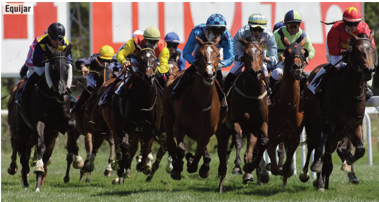
Ponce de León (azul claro), seguido de Whity (amarillo), se irá a ganar el José Luis de Salas.

“Le ha costado seguir de salida, pero ha progresado y al final se ha acercado al ganador, que tiene más velocidad que ella y se fue pronto. Tiene mucha distancia y el terreno blando le va a beneficiar”.