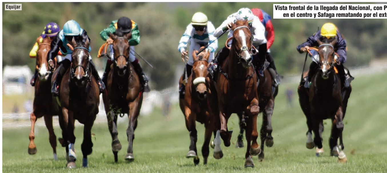
Vista frontal de la llegada del Nacional, con Pamplona en el centro y Safaga rematando por el exterior.