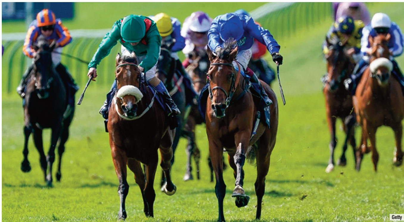
La pelea entre Mawj (azul) y Tahiyra .