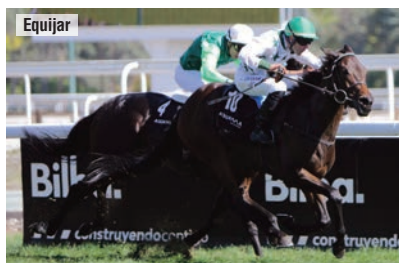
Su última carrera española, el Hispanidad que ganó ante Rodaballo.

“En su anterior carrera estuvo encerrado y no pudo demostrar lo que podía hacer. Estaba mas trabajado y tenía mucha fe en él. Terminó muy entero. Tiene que venir de atrás y espero que esta vez encuentre todos los semáforos en verde”.