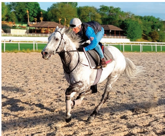
Ejercicio en corto de Speak in Colours, que pinta bien.