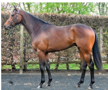
El top español, por Tamayuz y una hija de Pivotal.

Las cuadras españolas compararon menos corredores en las ventas de las Guineas de Tattersalls que en la breeze up de Osarus, pero se gastaron más dinero. Remataron siete productos por un total de 107.000 guineas. El mayor precio fue para el lote 198, un dos