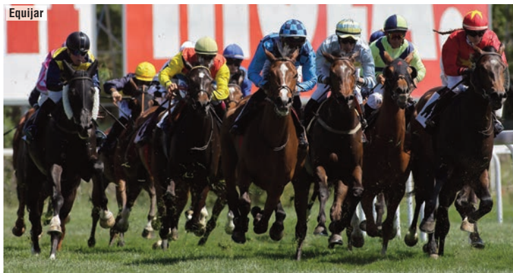
Ponce de León (azul claro), seguido de Whity (amarillo), se irá a ganar el José Luis de Salas.

“Le ha costado seguir de salida, pero ha progresado y al final se ha acercado al ganador, que tiene más velocidad que ella y se fue pronto. Tiene mucha distancia y el terreno blando le va a beneficiar”.