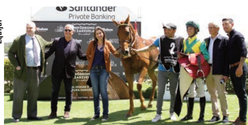
El equipo de Cielo de Madrid y Olave tras ganar el Corpa.