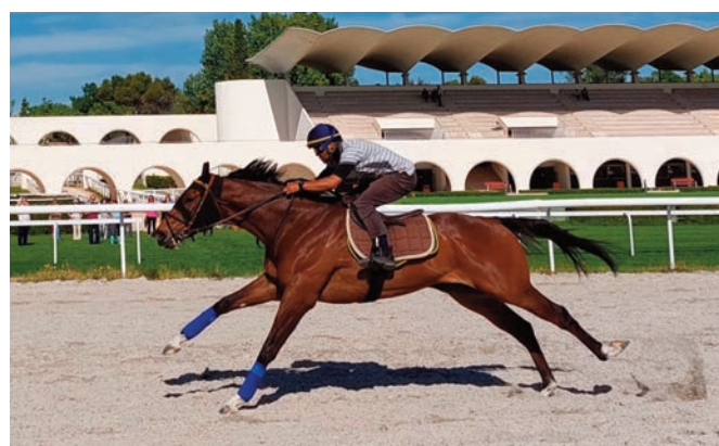
Bidul vuelve a demostrar que está en condición.

• Six Rivers (D. Sarabia) y Patrick Sarsfield no eran exigidos para hacer 1'11"50, 42"41 y 32"33. Cómodos.