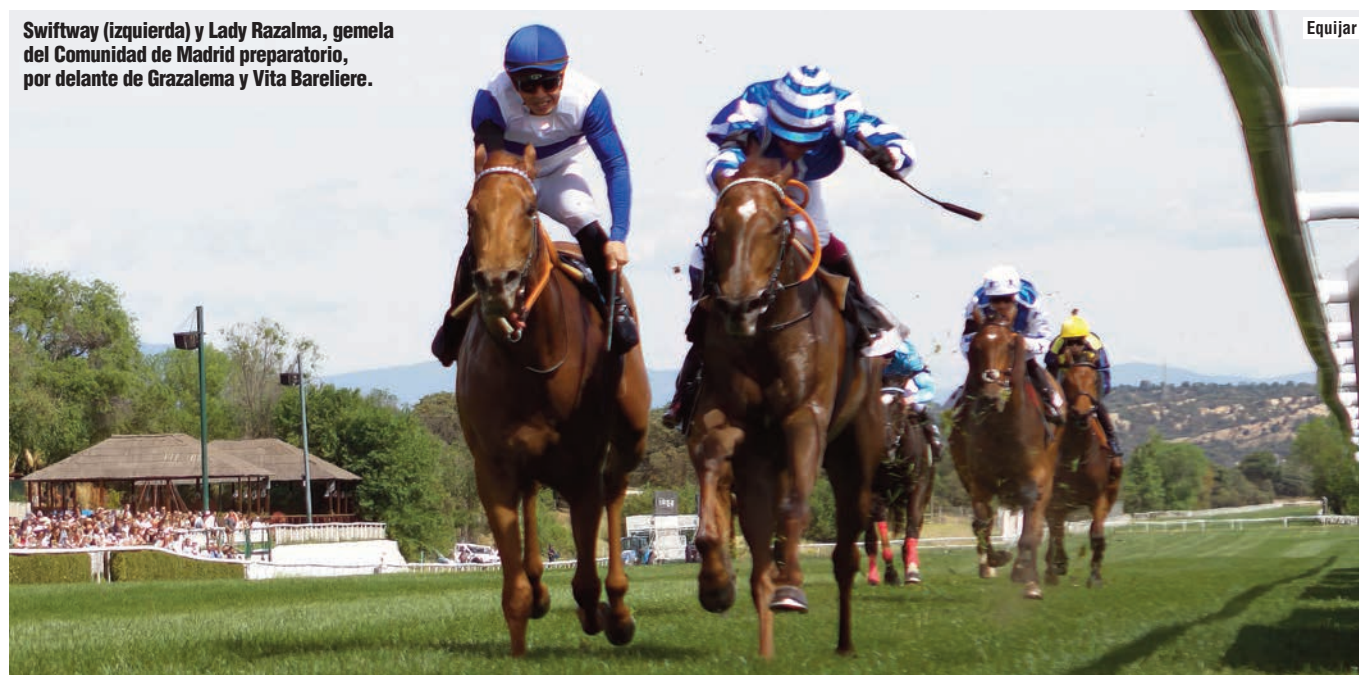
Swiftway (izquierda) y Lady Razalma, gemela del Comunidad de Madrid preparatorio, por delante de Grazalema y Vita Bareliere.