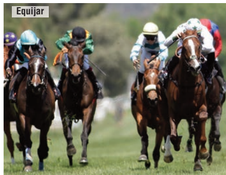
La yegua de Toledana-Becares, a la izquierda, segunda de Pamplona en el GP Nacional.

Si hubiera tenido la más mínima duda de que podría perjudicarlo no habría corrido. Quizá habría sido más seguro correr el Velayos, pero los