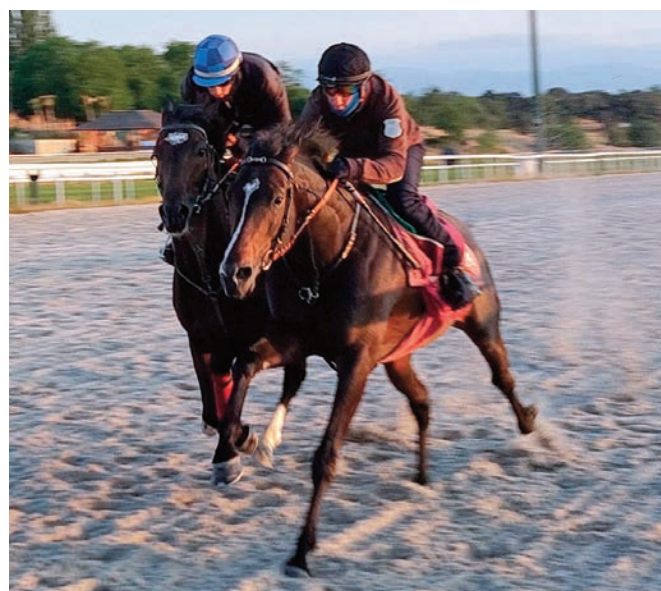
Australia Cape y Amtiyaz, parejos.