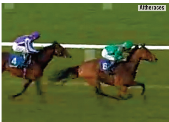
Victoria de 2012 en Tipperary.