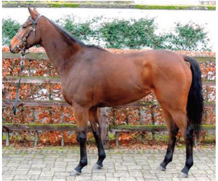
Ebalviyra, por Anabaa y Ebareva, origen Aga Khan.