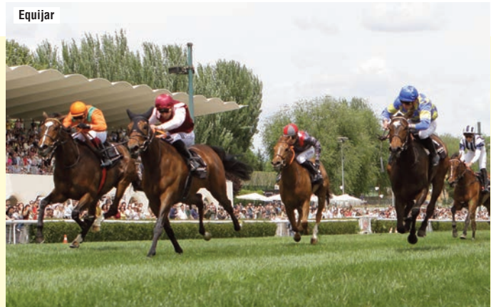
A la izquierda, tercera de Love for Life y Lady Frasquita en la milla del Valderas.