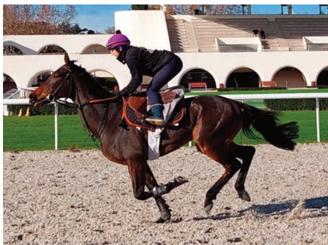
Master of Reality, afinando para debutar en Madrid.