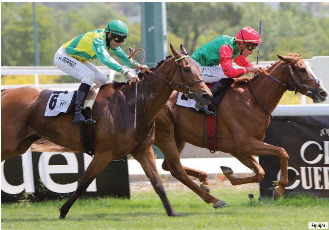
Hardpia, conductora siempre, aguantó el final de Winters's Tale, una que promete.

📢 El premio Teresa acabó reducido a un sprint de 500 metros en el que la aceleración final de Winter's Tale estuvo a punto de sorprender a una Hardpia aburrida de ir delante. Carrera mentirosa.