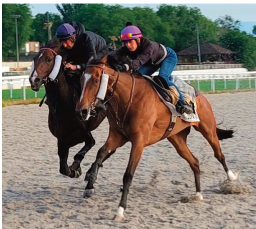
Atlantic Noth y Chikatop en primer plano trabajaron rápido.

• Jasperoid (J. Horcajada) en solitario terminaba el sábado en 1'04"13, 40"95 y 31"93. Buena apuesta en San Sebastián.