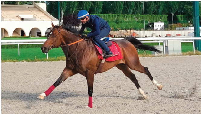
El Bosnia, candidatísimo al Urquijo.