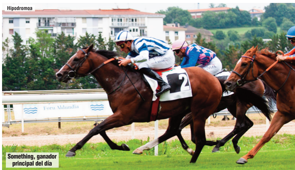
Something, ganador principal del día