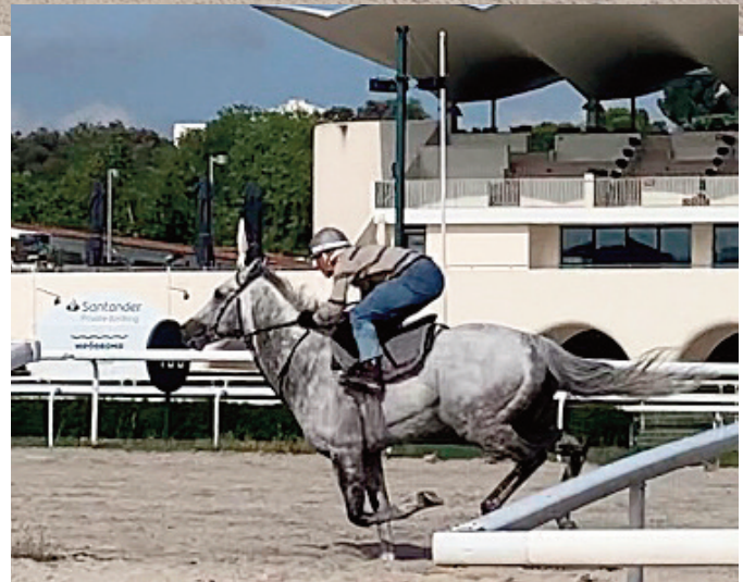
Speak in Colours, con su entrenador en la montura.

Gran mil. Obligados a mejorar con esos cronos.