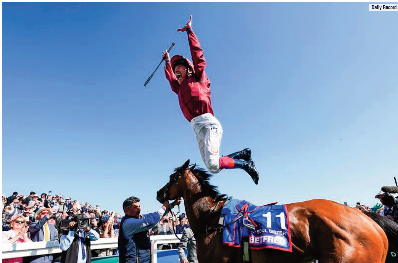
La alegría por el último y séptimo Oaks de Dettori, con Soul Sister.