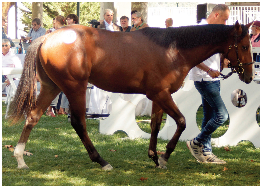
Villarrobledo, por Bobby's Kitten y Abril, de la yeguada Rocío.