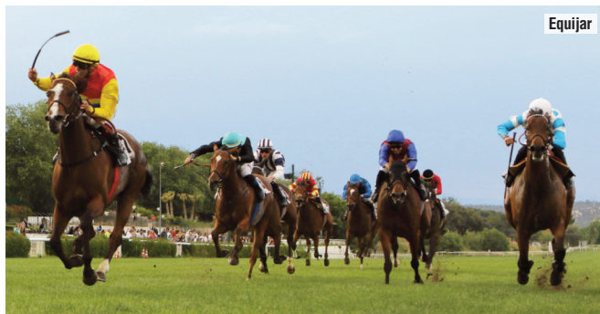
Upa Lola en el Baratissima.