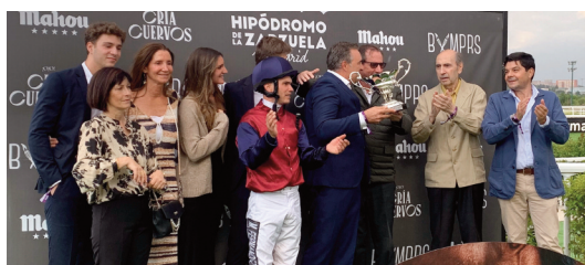
El equipo de la cuadra Agrado en el podio del Derby Español.