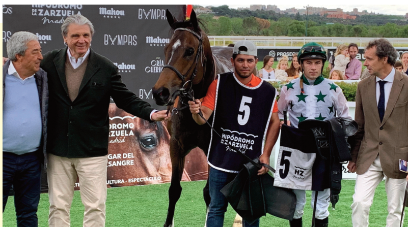
El equipo del caballo de Rocío, tras la victoria en el San Isidro.

En el premio San Isidro la superioridad de El Bosnia fue manifiesta y ello le convierte en el caballo a batir. Se le vio más rápido que en anteriores ocasiones, por lo que el ligero recorte de distancia no debe perjudicarlo excesivamente. Más cerrada se presume la lucha por la segunda plaza. United States fue por el este-