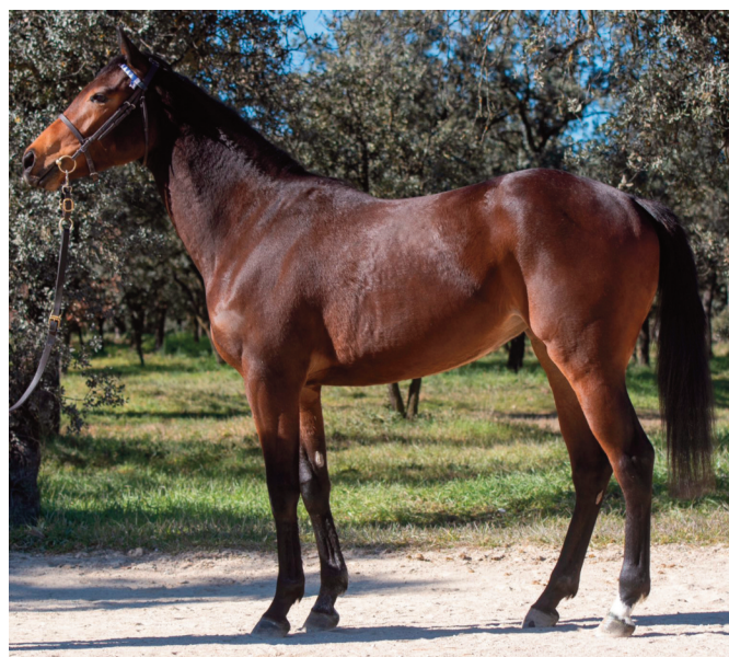
Reve de Stars, por Cloth of the Stars, de Soto y Mediterráneo procedente de Arqana.

potros en primavera. En teoría los que presentan mejor perfil, de sus seis candidatos, son los que no han debutado: Amadora (Cloth of Stars), Saskaton (Ten Sovering) y Bloody Moon (Morpheus). Ímaz detaca sobre todo a Saskaton: “Iba demasiado bien y lo tuve que parar pues es nacido en mayo y no quería que corriera sin tener dos años. Seguramente comenzará en la carrera de debutantes de San Sebastián. De los que han corrido la que mas progreso debe tener es Sovereign, que es muy seria y nacida en mayo. Princess Child tiene muchas facultades y es nacida en enero, pero no se