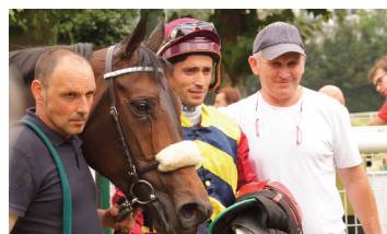
El último ganador del luso, la yegua Farzaneh, de Calderón.

Sikorová, 12 victorias y 17% de efectividad