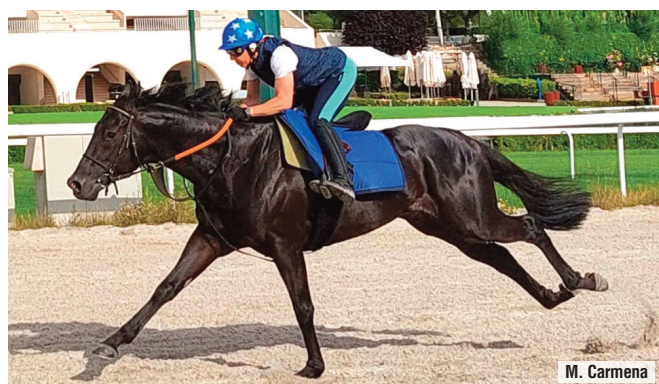
Peaky Blinders, caballo con muchas opciones en la tercera etapa.