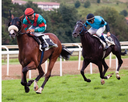
Con Cielo Canarias, en el Gobierno Vasco 2015.