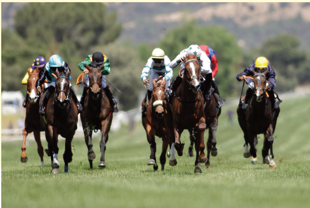
Faith Rose (azul y blanco, tercero) superó a Flaming Glass (verde) y Filippo (izquierda) en el Nacional.

Selección: Faith Rose Alternativa: Flaming Glass