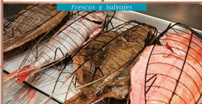
Frescos y salvajes