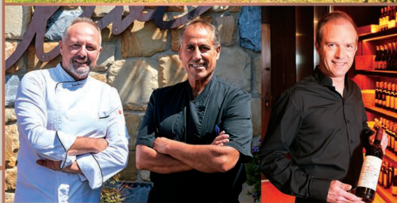
Los Nombres del Equipo: