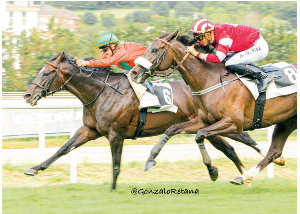
Tesla se coló por dentro a Sterling Gold.