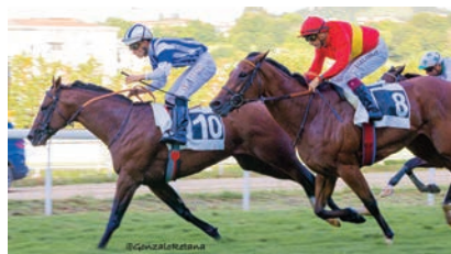
Something, Noisy Night y Raiku en los 1400 m.

Anaya logró su victoria 500 en España con Stour