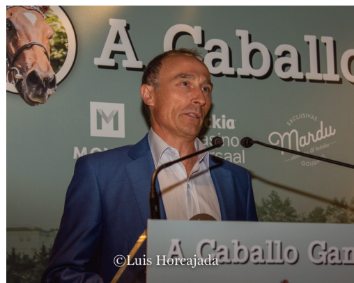
Anaya, preparador del año con récord de victorias.