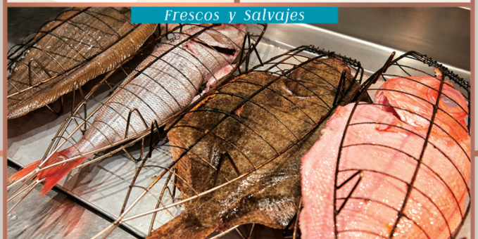
Frescos y Salvajes