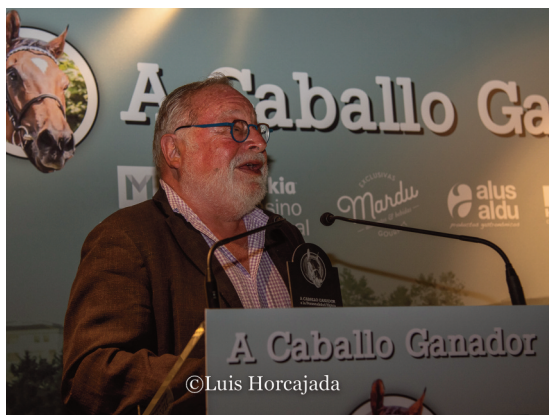
Fernando Savater, galardonado por su labor divulgativa del turf.