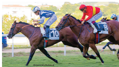
Something, Noisy Night y Raiku en los 1400 m.

Anaya logró su victoria 500 en España con Stour