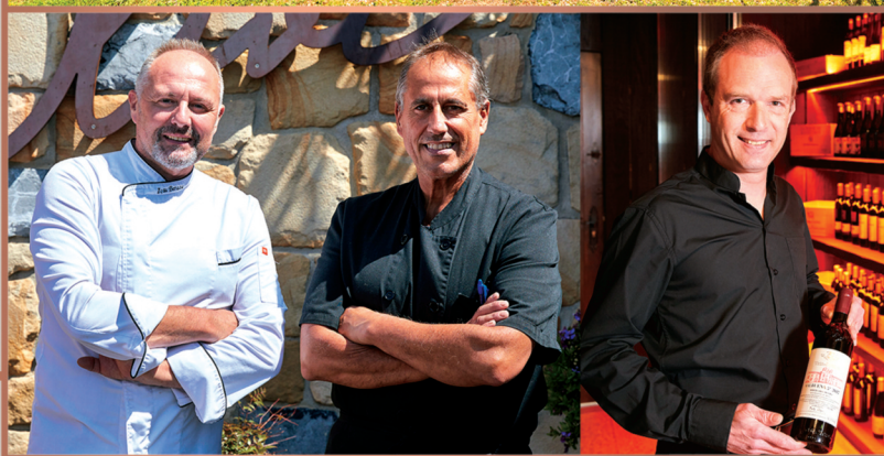
Los Nombres del Equipo: