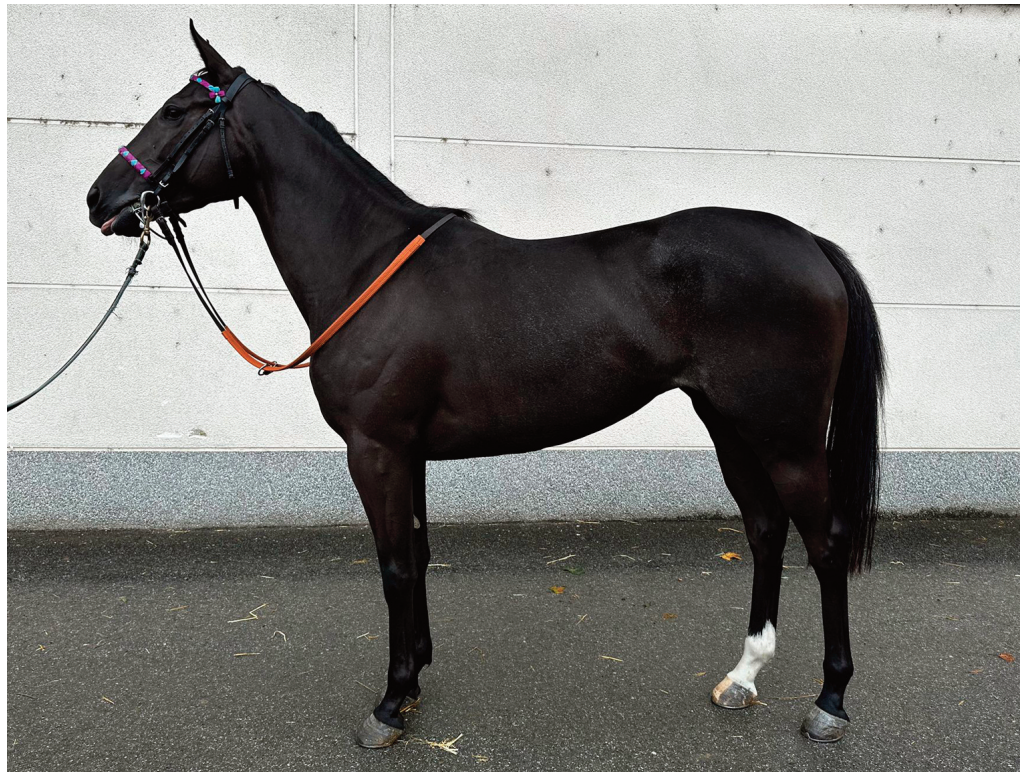
Potita, la dos años hija de Totxo y Poti, un calco de su madre.

“Paper Trophy es muy duro y se encuentra en un excelente momento de forma. Correrá el Gran Premio de San Sebastián, no tiene que viajar, está en su casa, es muy peleón y se lo va a poner muy difícil al que quiera ganar, y más si llueve y la pista está blanda”