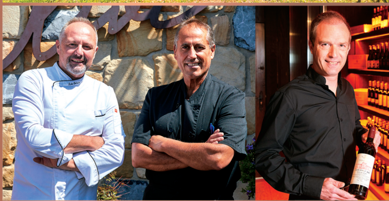
Los Nombres del Equipo: