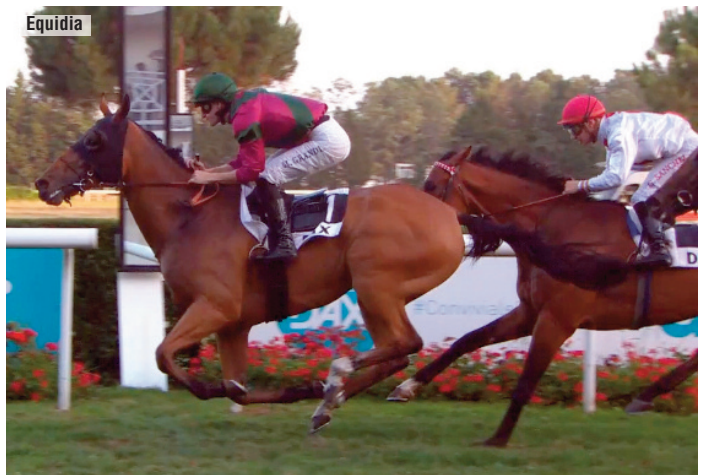
Mandalorian, segundo de Belgian Prince en el GP de Dax.

“Tengo 72 años y hace mucho que tendría que haberme jubilado, pero las carreras y los caballos cada vez me gustan más. Todavía me quedan muchas carreras por ganar”