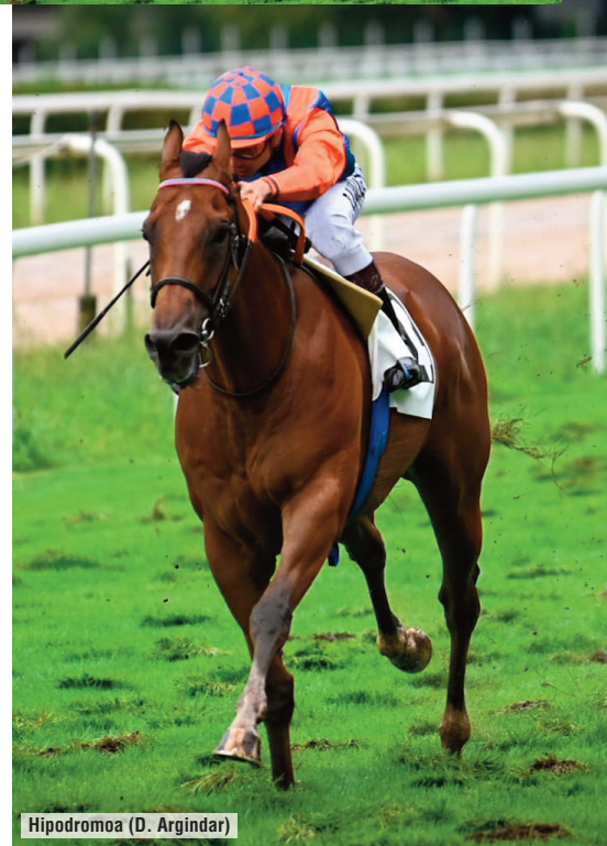
Hipodromoa (D. Argindar)