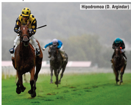
Hipodromoa