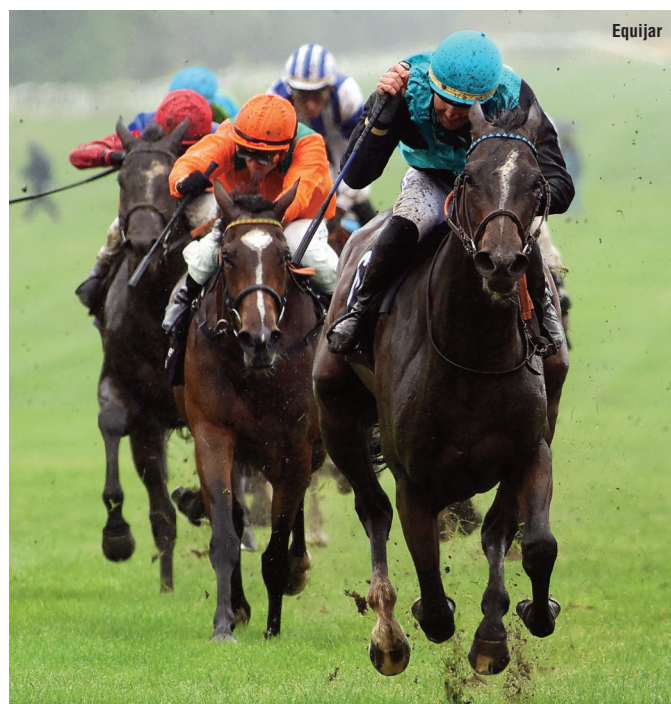
La gemela del Beamonte, Safaga, inscrita en tres pruebas, y War of Dance, con poker de matrículas.