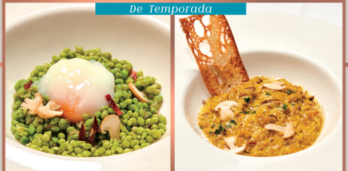
Frescos y Salvajes