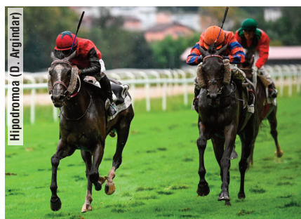
Hipodromoa (D. Argindar)

“Salieron bastante deprisa y preferí dejarla tranquila y progresar poco a poco. En la recta sus rivales se abrieron, no quise arriesgar e irme con ellos, siguió en su carril avanzando y en la meta tuvimos suerte”.