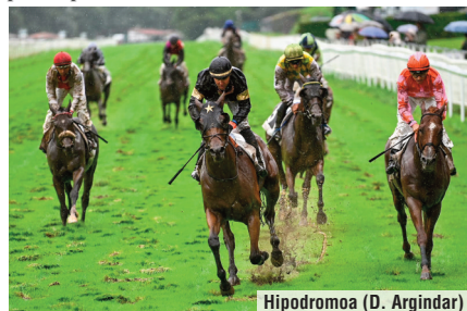
Hipodromoa (D. Argindar)

“Es un caballo con una edad, con el ya había ganado hace años en San Sebastián con pista pesada y de nuevo en este terreno ha confirmado, bien es verdad que ha costado mantenerlo concentrado y cerca de los punteros. He entrado en la recta con caballo, pero no tiene cambio de ritmo y ha costado mucho aguantar hasta el final. La pista está muy, muy pesada, y habría que intentar guardar las calles interiores para el Gran Premio de la próxima semana y me da mucha pena que algunos jockeys no entiendan que no hay que ir por dentro, que en esta pista tienen que galopar por fuera cuando está embarrada. Todavía tienen que aprender, poco a poco”.