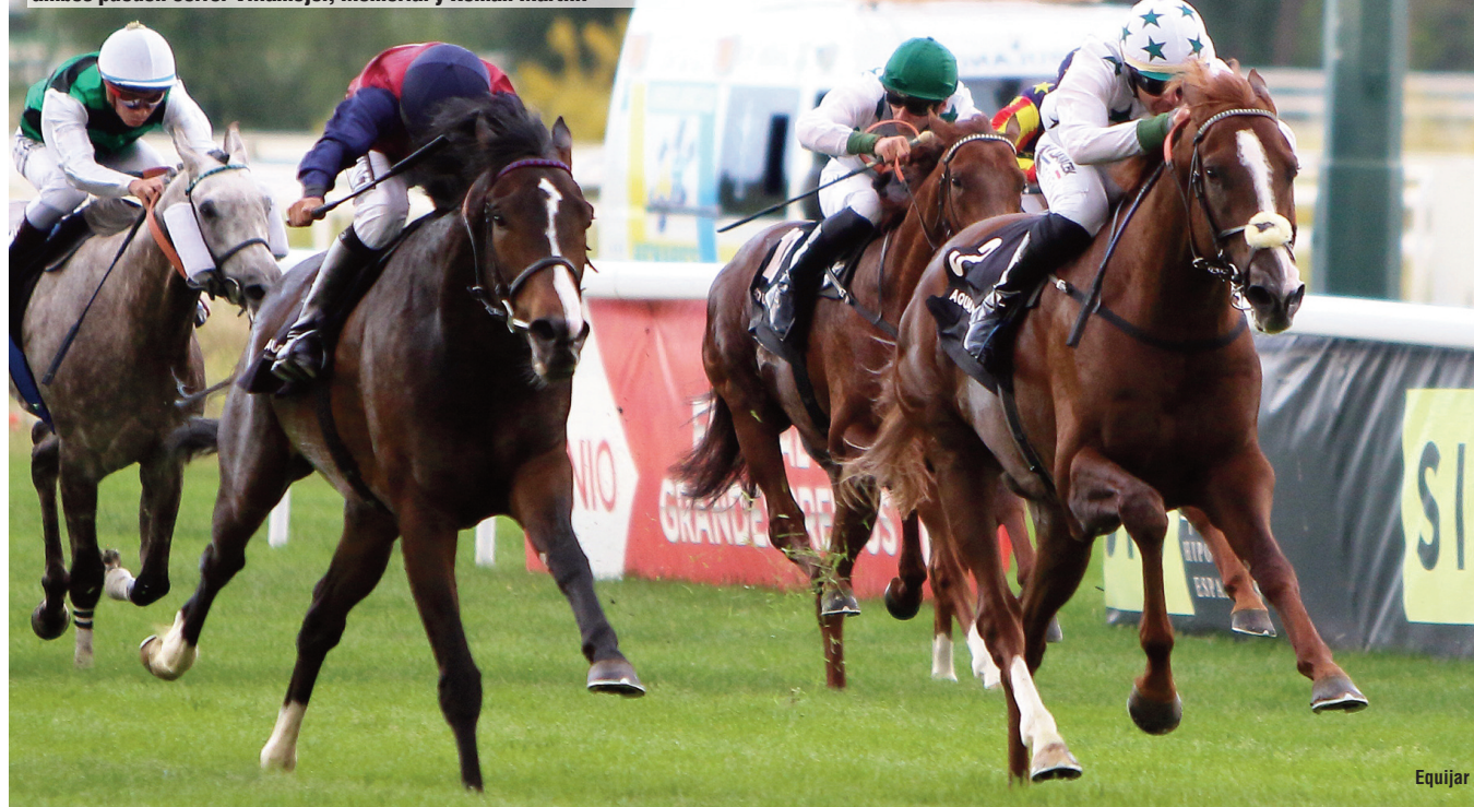
Kowalsy, inédito desde que dejara segundo a Pamplona en el derby, ambos pueden correr Villamejor, Memorial y Román Martín.