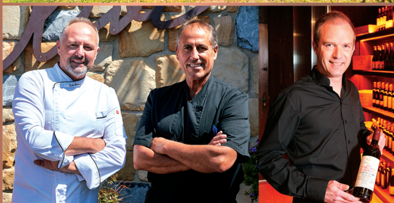
Los Nombres del Equipo: