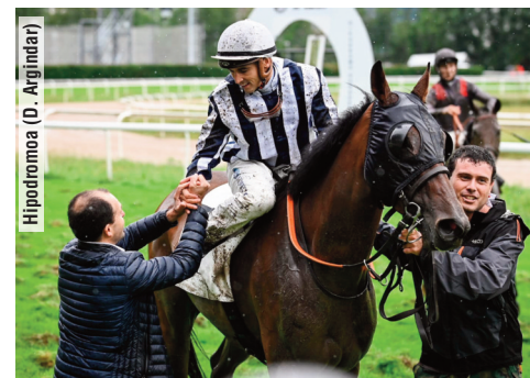
Hipodromoa