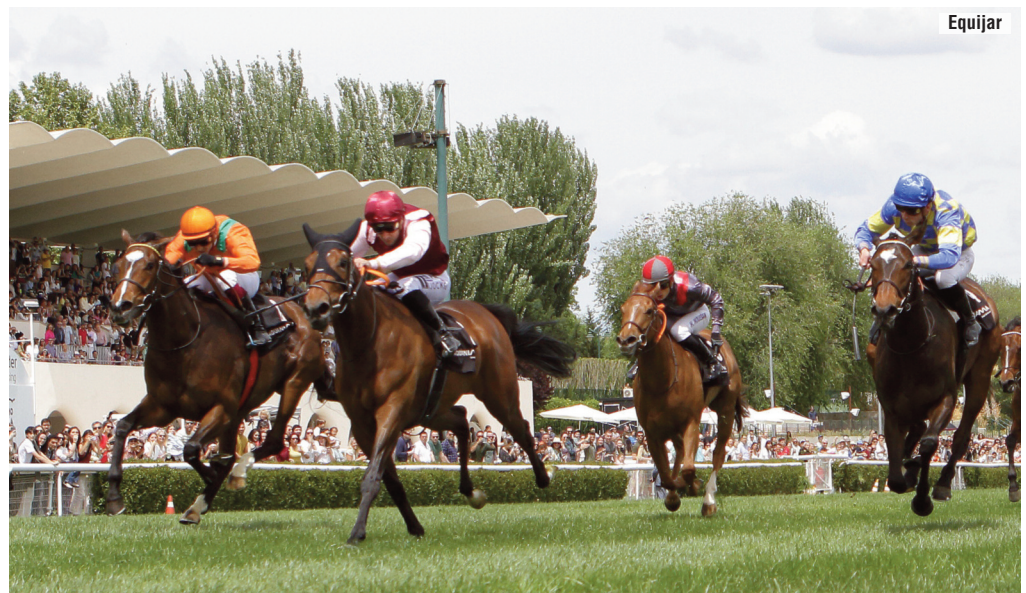
El triunfo de Love for Life (centro) en el Valderas primavera.

Tengo una cuadra bastante competitiva, pero sólo cuento con nueve caballos corriendo y no puedo competir con cuadras que tienen treinta o más. Vamos a intentar mantenernos, al menos.