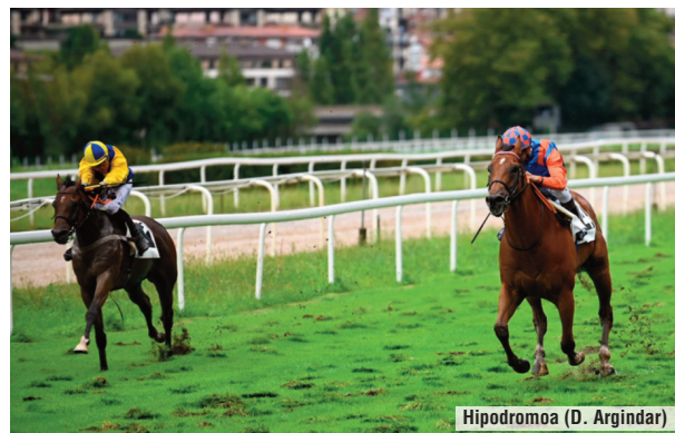
Hipodromoa (D. Argindar)

“Es muy rápido, la línea recta en Madrid se le hace eterna, pero en curva se maneja mejor. Llegaba fresco, con pocas carreras en el año, y lo ha aprovechado. Es un tiro, mejor en 1.000 metros que en 1.200. Debutó ganado en Newmarket y luego salió favorito en un Grupo 2. Tiene calidad y hemos tenido mucha paciencia con él. Las suyas han sido unas de las mejores 2.000 libras que hemos gastado”.