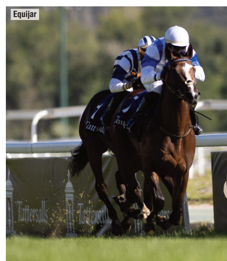
Velerín sobrepasó al puntero Be True con un gran cambio de ritmo.