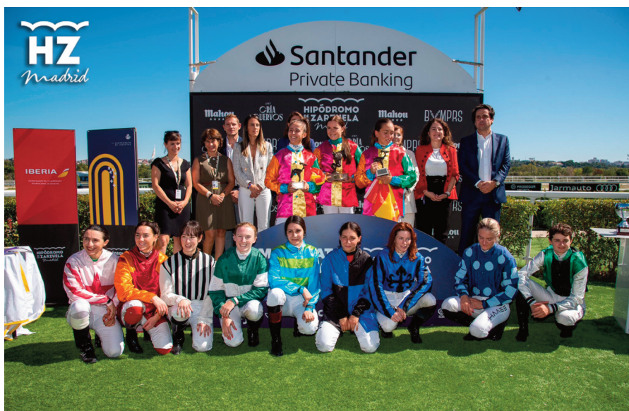
Las triunfadoras en el campeonato de jocketas, el resto de participantes y las autoridades.