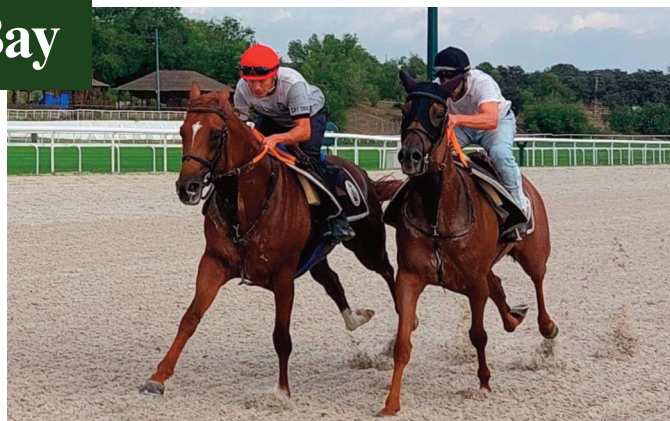
White Bay ejercitándose con Spanish Ruler.

• Lady Aida (J.L. Borrego) marcaba ritmo de trabajo a Fuera Light (Fayos), que era más exigido para hacer 1'05"59 , 40"41 y 31"57 . Van mejorando. • Gustaba White Bay (D. Benítez) en su trabajo del sábado: 1'03"24 , 40"43 y 31"79 . Baja de nivel. Días atrás perfiló puesta a punto con Spanish Ruler . • En solitario Akaral trabajaba en corto: 40"12 y 30"36 . Con mejora. • Tessico (Fayos) en solitario demostraba condición: 1'03"96 , 41"12 y 31"47 . Apretó de finales. • Tazones de menos a más re-