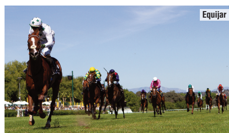
Pamplona perdió a sus rivales en el Villamejor.