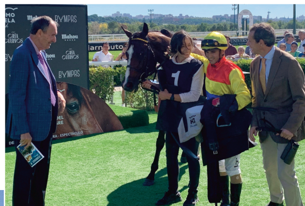
La yeguada AGF se llevó los trofeos del premio Cocheteux con Upa Lola.