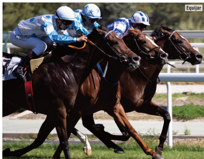
Tammani viene a superar a Machu Picchu, otro de Anaya, y el puntero Something.