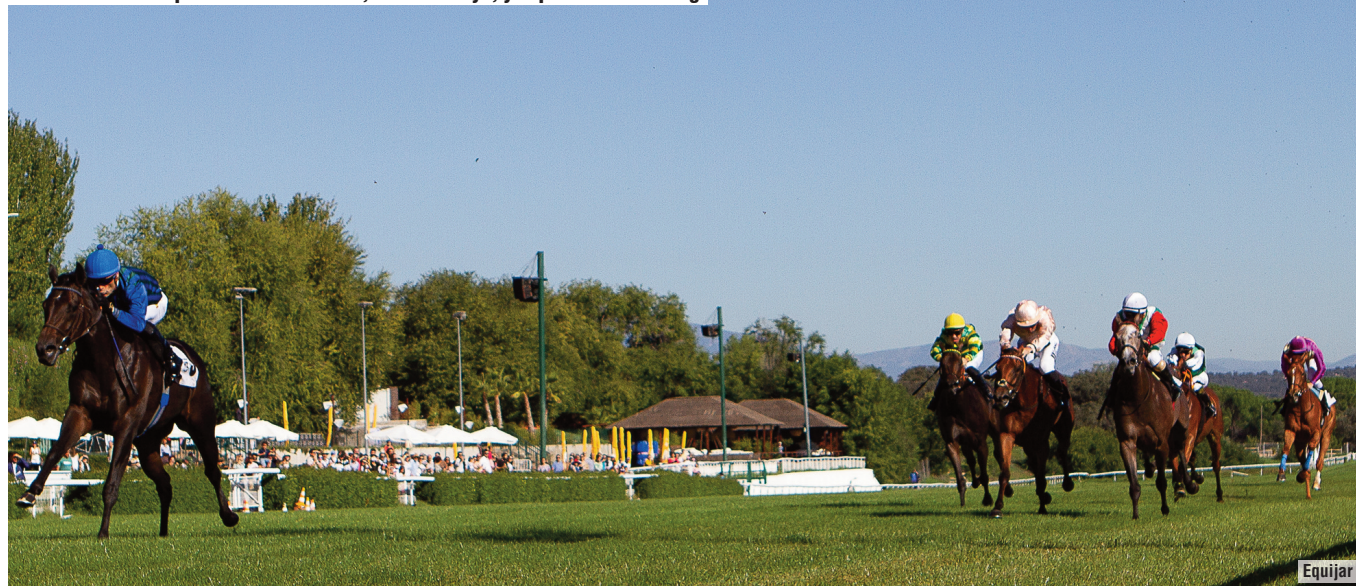
Villa de Leyva, muy superior en la carrera de apertura para los dos años.