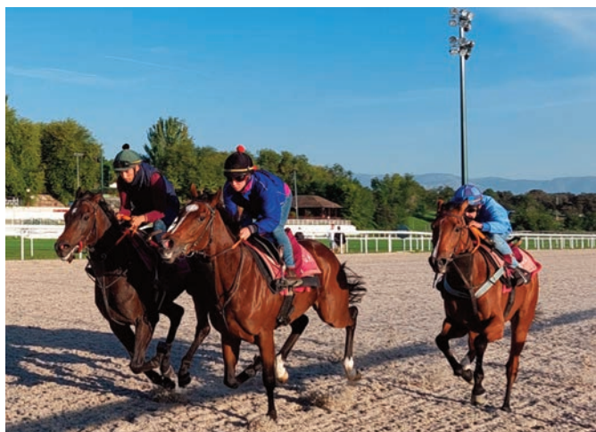
Maderas, War of Dance y Grazalema, de menos a más.