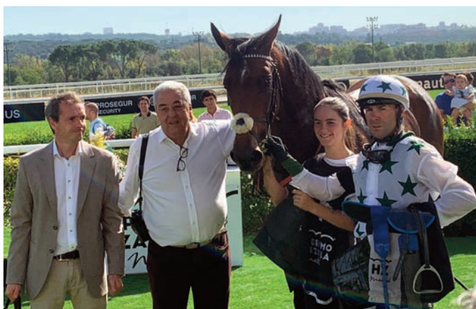
Arizkorreta y Janáček ganaron para Rocío con Farnesio y Ayala.