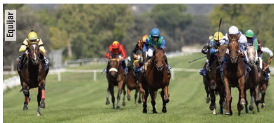
Con Joker (derecha) en el Gran Premio Subasta.

Ocho victorias en sus últimas diez montas