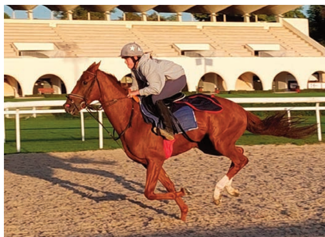
El nuevo Magical Beat, alemán por Lope de Vega.