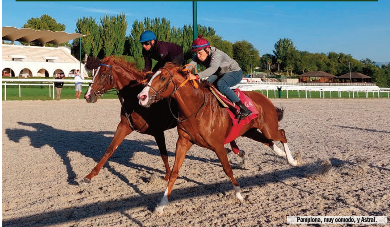
Pamplona, muy comodo, y Astral.