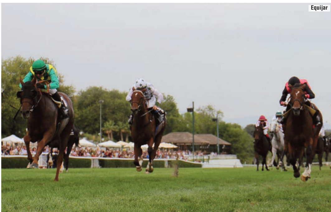
La llegada del Memorial 2022 ganado por The Game (verde) ante Media Storm y The Way of Bonnie (blanco).