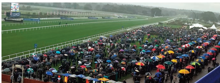
Las lluvias y estado pesado de la pista marcaron la última edición del mitin de Ascot.