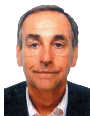
Texto y fotos: Ramiro Cibrian

PASEO EN LA MILLA DEL QUEEN ELIZABETH II PARA EL DE PUJALS Y REMONTADA HISTÓRICA EN EL CHAMPION STAKES DEL CRACK ITALIANO