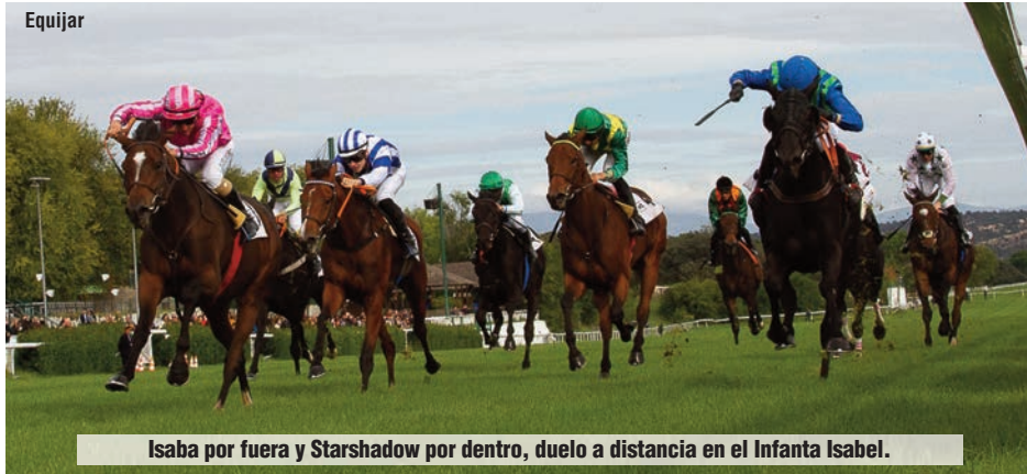
Isaba por fuera y Starshadow por dentro, duelo a distancia en el Infanta Isabel.