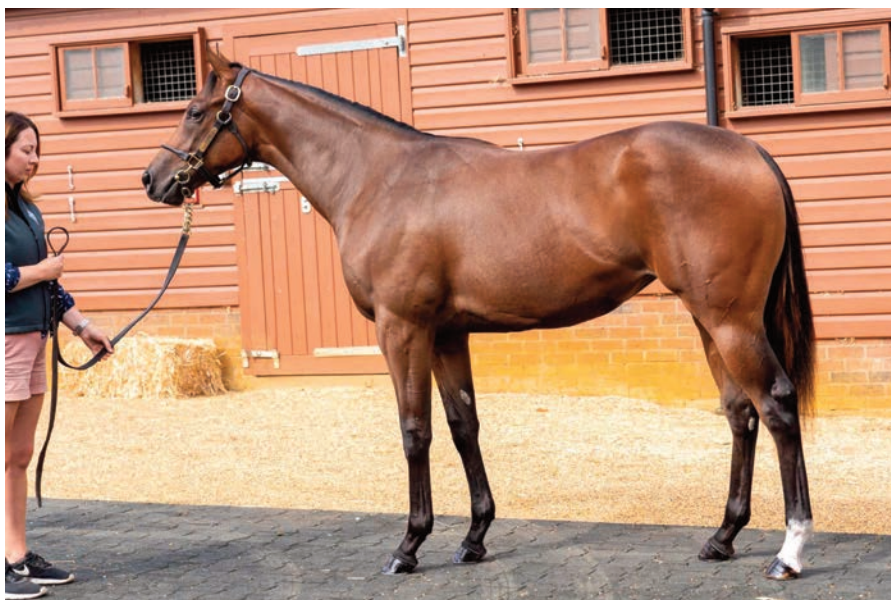
Sophie's Watch, de yearling, cuando mereció 55.000 guineas.

La semana pasada escribió el genial Hoquis en estas páginas: “En tiempos convulsos en los que se buscan soluciones para la cría nacional, creo que la pista de competición nos sigue marcando el camino: si se consigue que yeguas como Samedi Rien , War of Dance , Hardpia , Upa Lola , Sophie's Watch y otras como ellas se queden en España, el primer paso estaría dado. Repito: la clase es lo primero”. Contemos a Love for Life en ese “otras como ellas;” cómo no, y cantemos amén. La clase, en efecto, es lo primero.