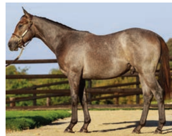
El hijo de Sottsass, la compra más cara de AGF.