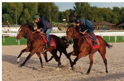
X Rays y Velerín, acompañados por White Wine.

• White Wine acompañaba a Velerín y X Rays en su mantenimiento del sábado: 1'13"33, 43"67 y 32"92. Cómodos. Potros con futuro. • Warrior's Revenge (Ramos) y Souvenir d'Ecajeul (Janáček) trabajaban con parciales de 1'05"06, 39"70 y 30"63. Gustaron. • Super Rafale (ganador en La Teste, valor 37), nuevo fichaje de la preparación de Christian Delcher, y Alwaseer