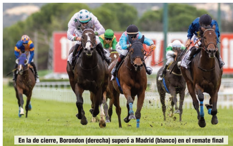
En la de cierre, Borondón (derecha) superó a Madrid (blanco) en el remate final