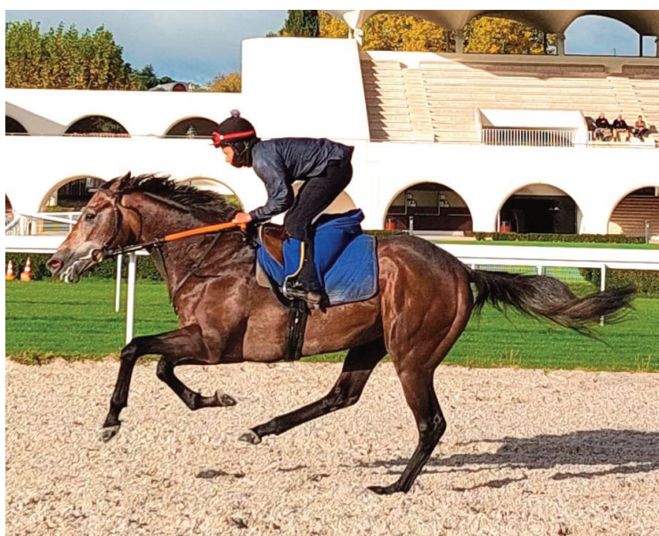
Ejercicio de mantenimiento de Irish Breath.