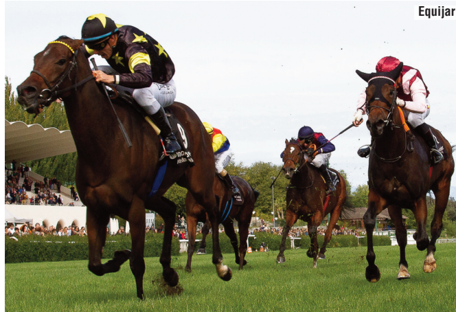
Sophie's Watch en el Reapertura , ante Love for Life , Upa Lola y Kendaya , un cuarteto de yeguas con futuro en el haras.

Apenas queda el criador-propietario, y menos mal porque eso nos lleva a esperar, eso sí, a los hijos de Super Trip (Triple Threat) o Kendaya (Free Eagle). Y entonces vuelvo al primer párrafo: ¿es bueno, malo o irrelevante que haya sido una temporada de buenas hembras? Frente a quienes responderán que da igual, “porque la cría está prácticamente muerta”, yo prefiero pensar que peor sería no tener ni cría ni yeguas para revitalizarla, y que mientras haya vida (buenas hembras), habrá esperanza y un motivo para trabajar por levantar eso que muchos creen perdido. Sé que podemos.