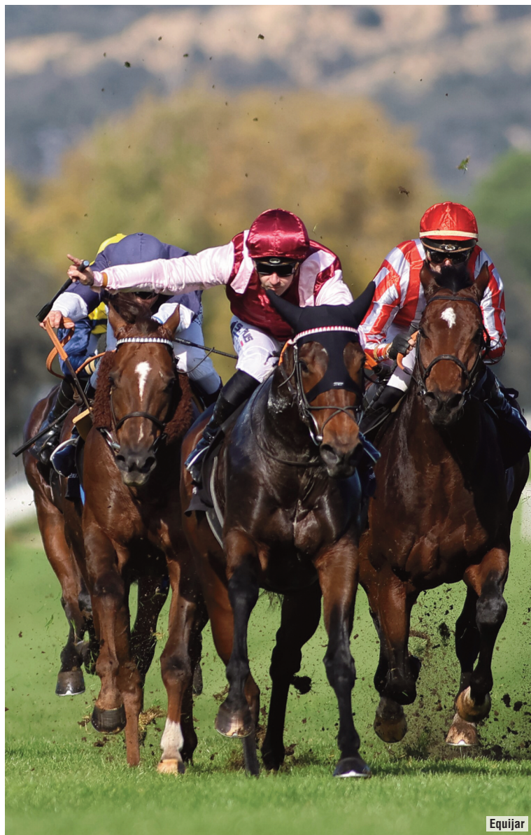
Magic Light salió de maiden en su primera actuación en España.