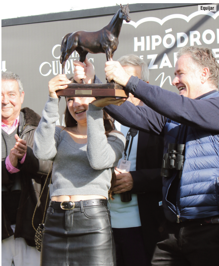
Parte de los integrantes de la cuadra Wine & Roses, con el trofeo del Blasco.

24 personas participaron en la entrega de premios del Antonio Blasco aunque, sabiendo que la cuadra Wine & R oses está formada por 15 socios con sus respectivas familias, pocas me parecen. En el podio no cabía tanta gente... ni tanta felicidad.