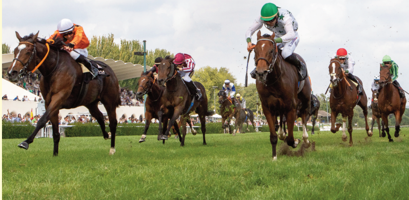
En el Memorial'23, el de Rocío (blanco) fue segundo y Finely Tuned (granate), tercero.