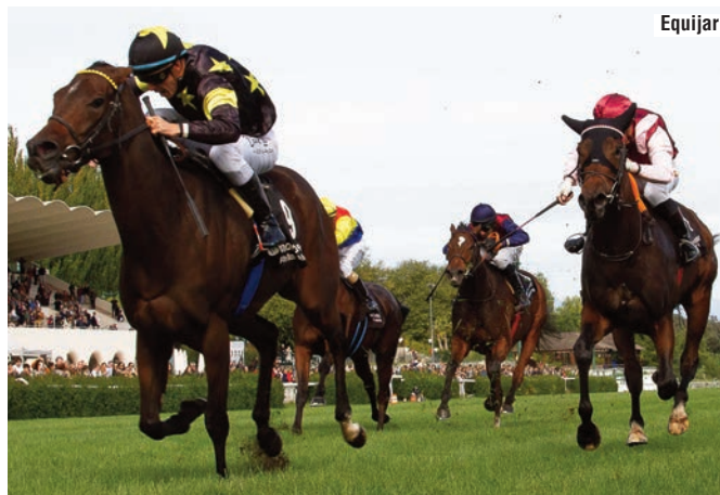
Sophie's Watch en el Reapertura , ante Love for Life , Upa Lola y Kendaya , un cuarteto de yeguas con futuro en el haras.

Apenas queda el criador-propietario, y menos mal porque eso nos lleva a esperar, eso sí, a los hijos de Super Trip (Triple Threat) o Kendaya (Free Eagle). Y entonces vuelvo al primer párrafo: ¿es bueno, malo o irrelevante que haya sido una temporada de buenas hembras? Frente a quienes responderán que da igual, “porque la cría está prácticamente muerta”, yo prefiero pensar que peor sería no tener ni cría ni yeguas para revitalizarla, y que mientras haya vida (buenas hembras), habrá esperanza y un motivo para trabajar por levantar eso que muchos creen perdido. Sé que podemos.