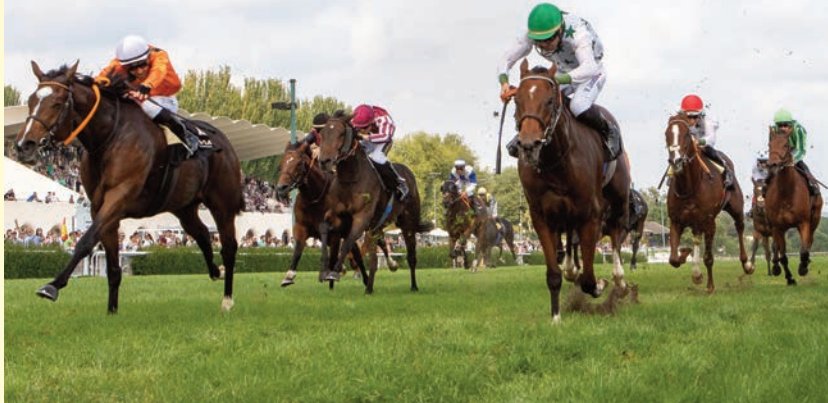
En el Memorial'23, el de Rocío (blanco) fue segundo y Finely Tuned (granate), tercero.