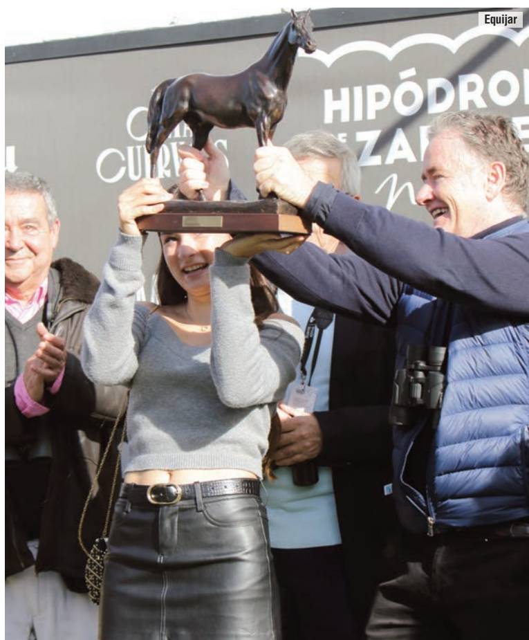
Parte de los integrantes de la cuadra Wine & Roses, con el trofeo del Blasco.

24 personas participaron en la entrega de premios del Antonio Blasco aunque, sabiendo que la cuadra Wine & R oses está formada por 15 socios con sus respectivas familias, pocas me parecen. En el podio no cabía tanta gente... ni tanta felicidad.