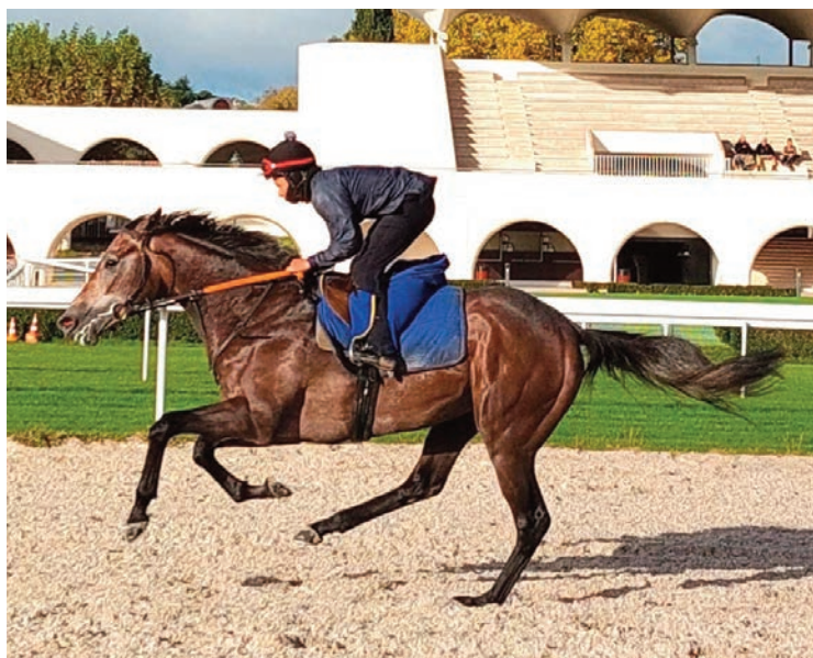
Ejercicio de mantenimiento de Irish Breath.