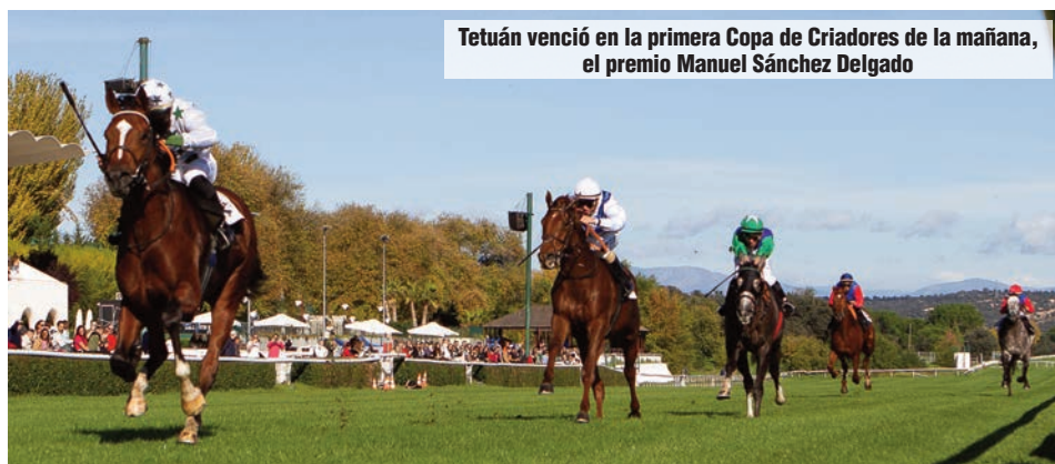
Tetuán venció en la primera Copa de Criadores de la mañana, el premio Manuel Sánchez Delgado