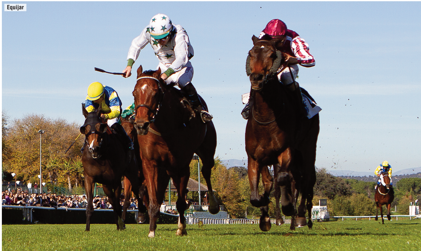
Ganador del Gladiateur, en 2024 The Way of Bonnie podría defender el título.

Y colorín colorado, el otoño muy pronto se ha acabado. No dejen de visitar Sevilla en los próximos cuatro meses. Y pásense por Casa Moreno . Me lo agradecerán.