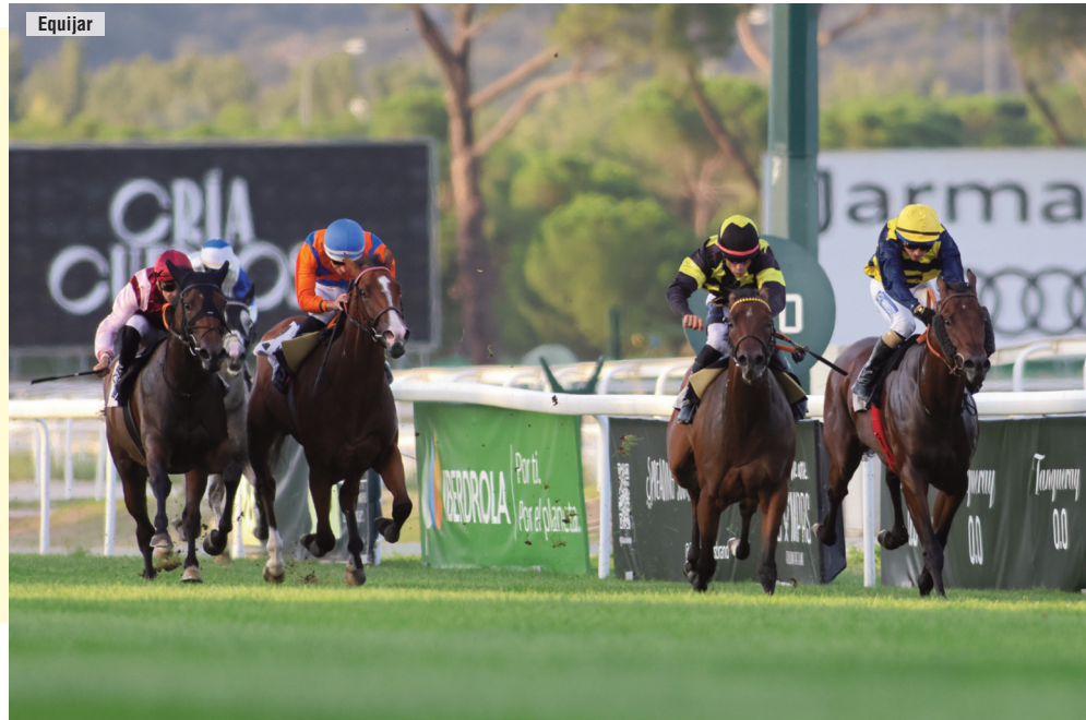
De naranja, será cuarto de Sophie's Watch , Witiza y Love for Life en septiembre.