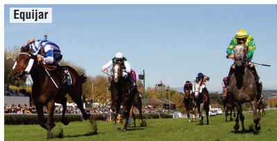
La gemela de Soto en el Veil Picard con Reves de Stars y Don Bosco.