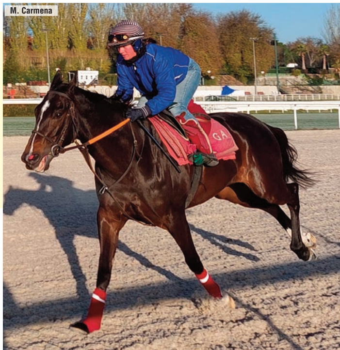
Raiku, preparando su carrera del domingo.