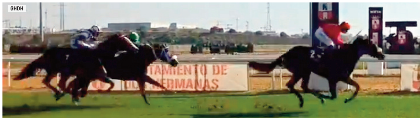
La cuadra San Cristóbal tiene en Orión un Noozhoh Canarias prometedor.