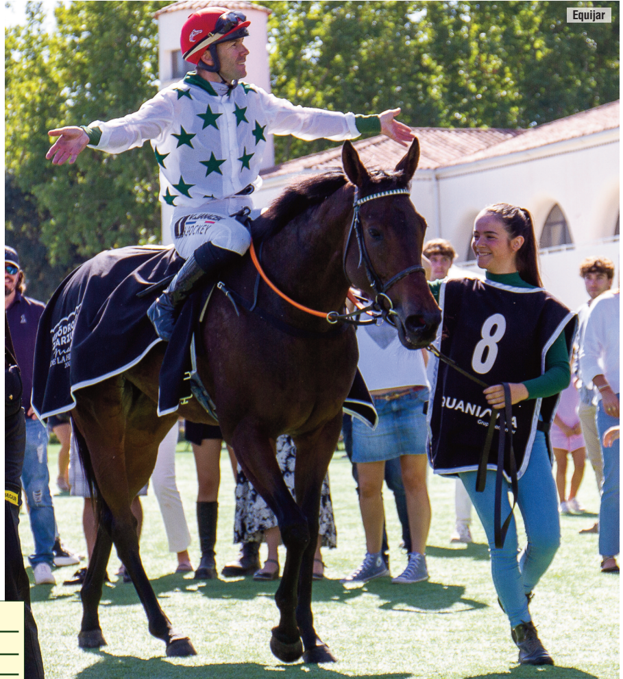
A lomos de Samedi Rien en su regreso triunfal tras el Hispanidad.

Si son 38 los primeros puestos que totaliza con Arizkorreta, el checo ha logrado por tan-