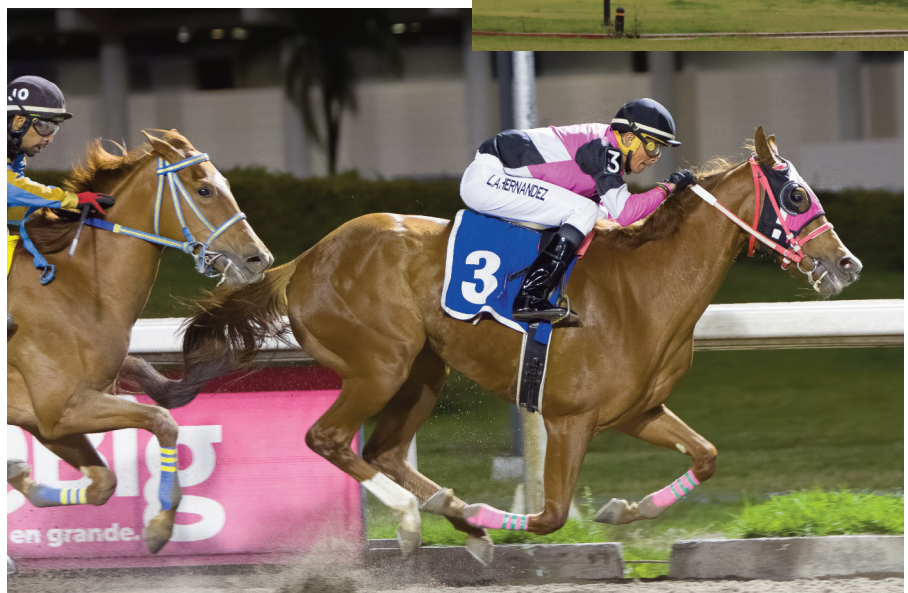
Jockeys mejicanos y panameños sueñan con los EEUU.