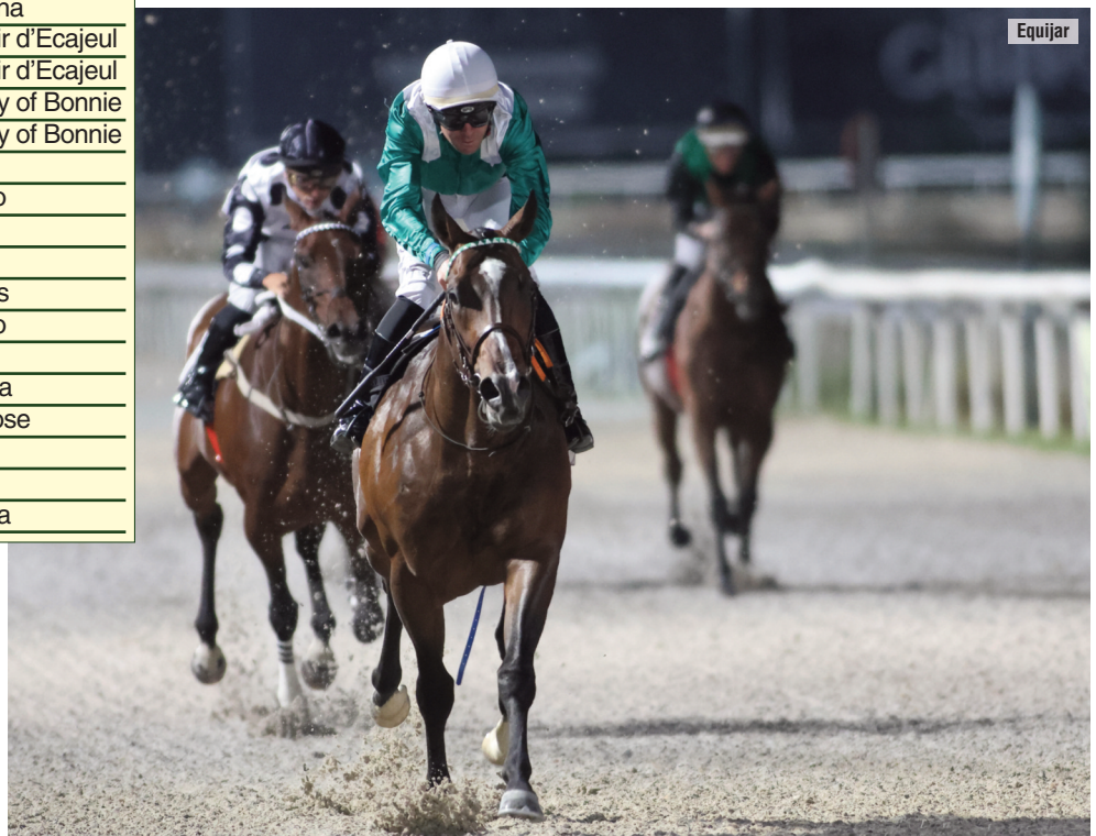
Con Juanillo, uno de los cinco caballos ganadores de Blas Rama.