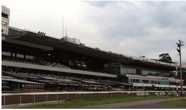
Una panorámica de sus grandes gradas.

Quienes tienen caballos de calidad intentan el sueño americano, y su mejor representante hasta la fecha ha sido Le-truska , yegua criada en 2016 precisa-