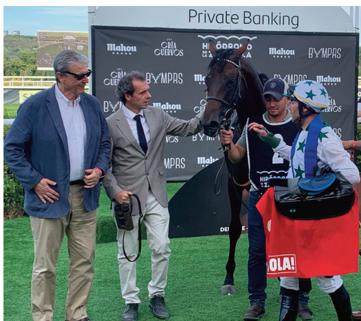
Naranco, ganador del Hipódromo de la Castellana para el equipo de Rocío.