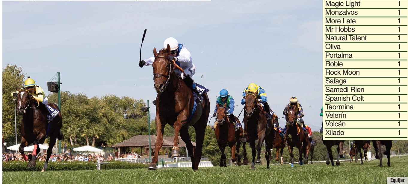
El Gran Premio Subasta de Joker, para la cuadra Y Todos para Una.