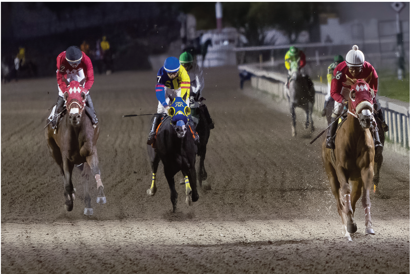
Las carreras son muy rápidas en su pista de arena.

A nivel personal, resultó una jornada genial y los representantes del hipódromo nos trataron muy bien. Lo más curioso de la experiencia fue que al charlar con los fotógrafos locales me sentí como si estuviera con los amigos españoles: tenemos la misma afición, los mismos problemas y vemos las cosas de forma muy parecida. Es curioso, un aficionado a las carreras suele encontrarse a gusto en cualquier hipódromo del mundo, donde pronto encuentra almas afines, y nosotros en nuestro pequeño recinto somos incapaces de llevarnos bien y de actuar todas a una en pos de lo que nos gusta. Deberíamos hacérselo mirar.