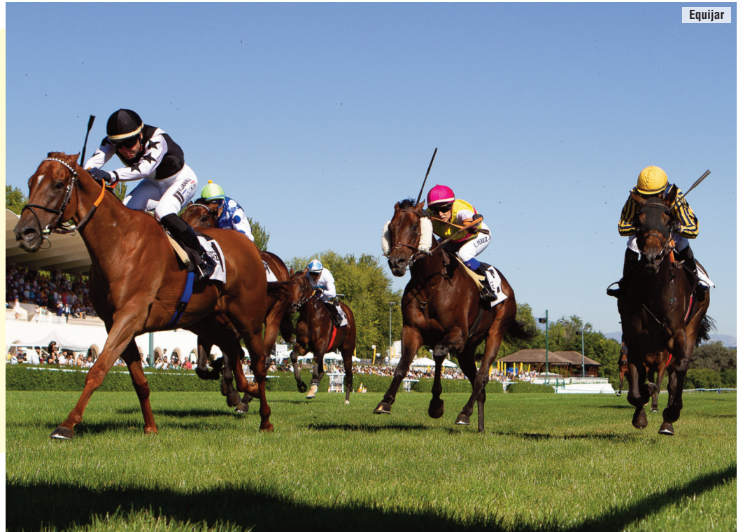
El 1 de octubre, en Madrid, por delante de Macadamia, Arenal y Tessico.