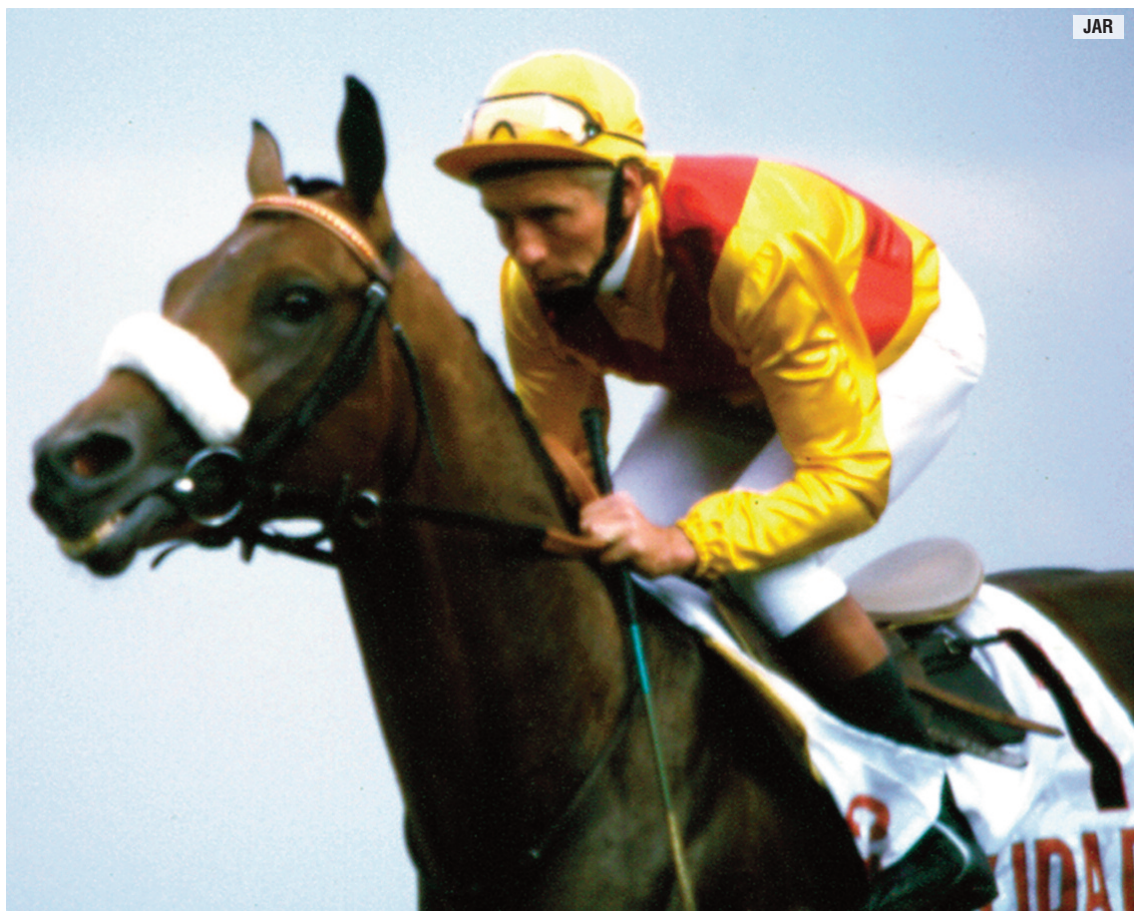
El Rubio de Oro y Casualidad, doble ganador del GP de Madrid.