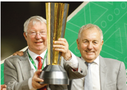
Sir Alex Ferguson, uno de los propietarios de Spirit Dancer, ganador en los 2.100 metros en hierba.