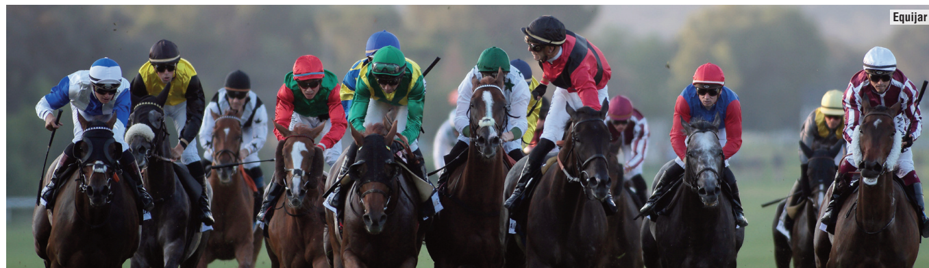
El Caney, The Game, Master of Reality y Capoeira formaron el cuarteto del Gran Premio de Madrid hace un año.