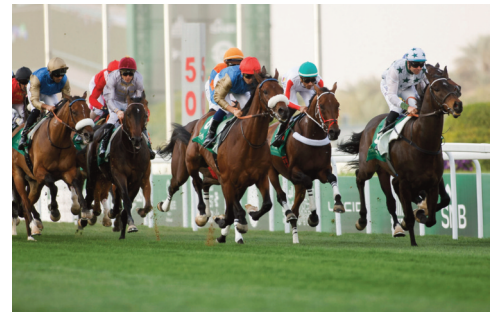
Desde salida, Furioso (blanco) figuró en las posiciones de vanguardia del Hándicap Internacional.