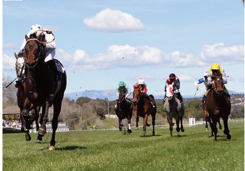
El campeón de Rocío y Arizcorreta, Naranco, aparece en el Alburquerque y GP de Madrid.