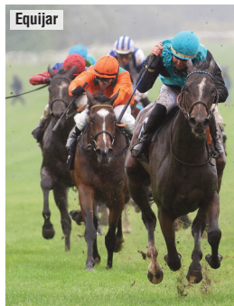
La gemela de Safaga y War of Dance en el Beamonte.