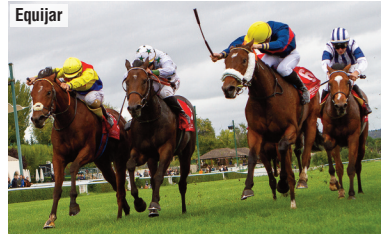
Moncloa (dcha), cuarto de Princess Child en octubre.