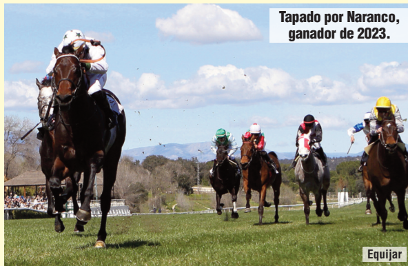
Tapado por Naranco , ganador de 2023.

Interesante preparatoria del Gran Premio Duque de Alburquerque. Lisicles es el participante de mayor clase del lote y sólo ha fallado en terrenos muy pesados o cuando corrió algo justo de forma como en el Gran Premio de Madrid. Segundo tras Naranco hace un año, si su condición es la adecuada, suya debe ser la primera opción ganadora. Furioso dio la cara en todos los compromisos que disputó