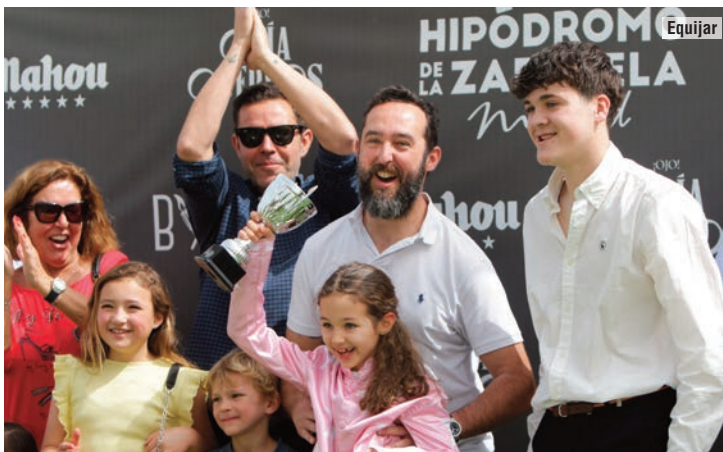
Los entusiastas propietarios de la yegua Belletti ganaron el premio Benito Martín.