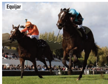
Primera y segunda del Román Martín 2023.

Safaga batió por ocho cuerpos a War of Dance en el Oaks y por uno en el Román Martín, mientras que la de la cuadra Peques superó a su rival en el Benítez de Lugo (2ª y 5ª). La hija de Lightning Moon llegó a estar inscrita en el Asociación de Hipódromos y ambas están matriculadas en el Albuquerque y en el GP de Madrid.