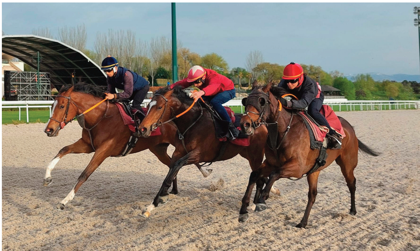
Chiquinino, Xerox y Sicilia, de dentro a fuera los tres años de Arizkorreta.