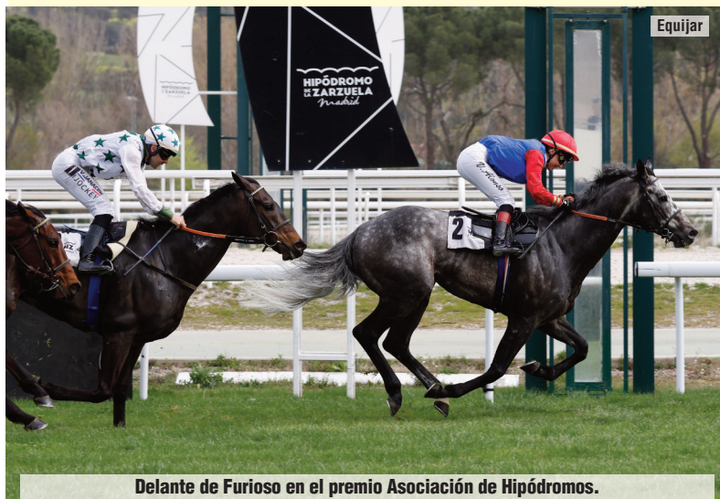
Delante de Furioso en el premio Asociación de Hipódromos.