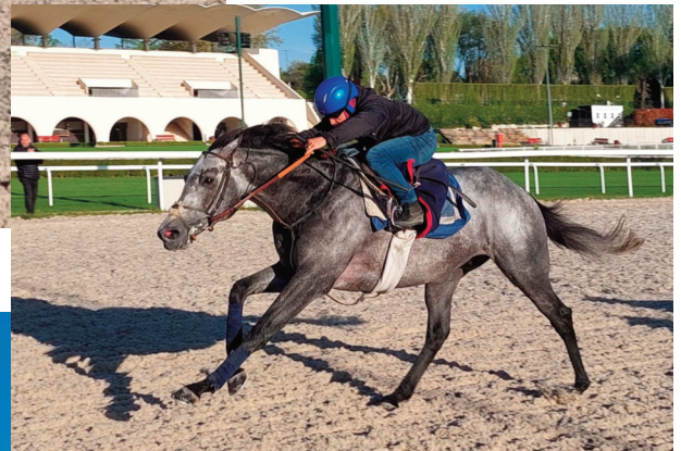
Lion Kingdom, trabajando serio.