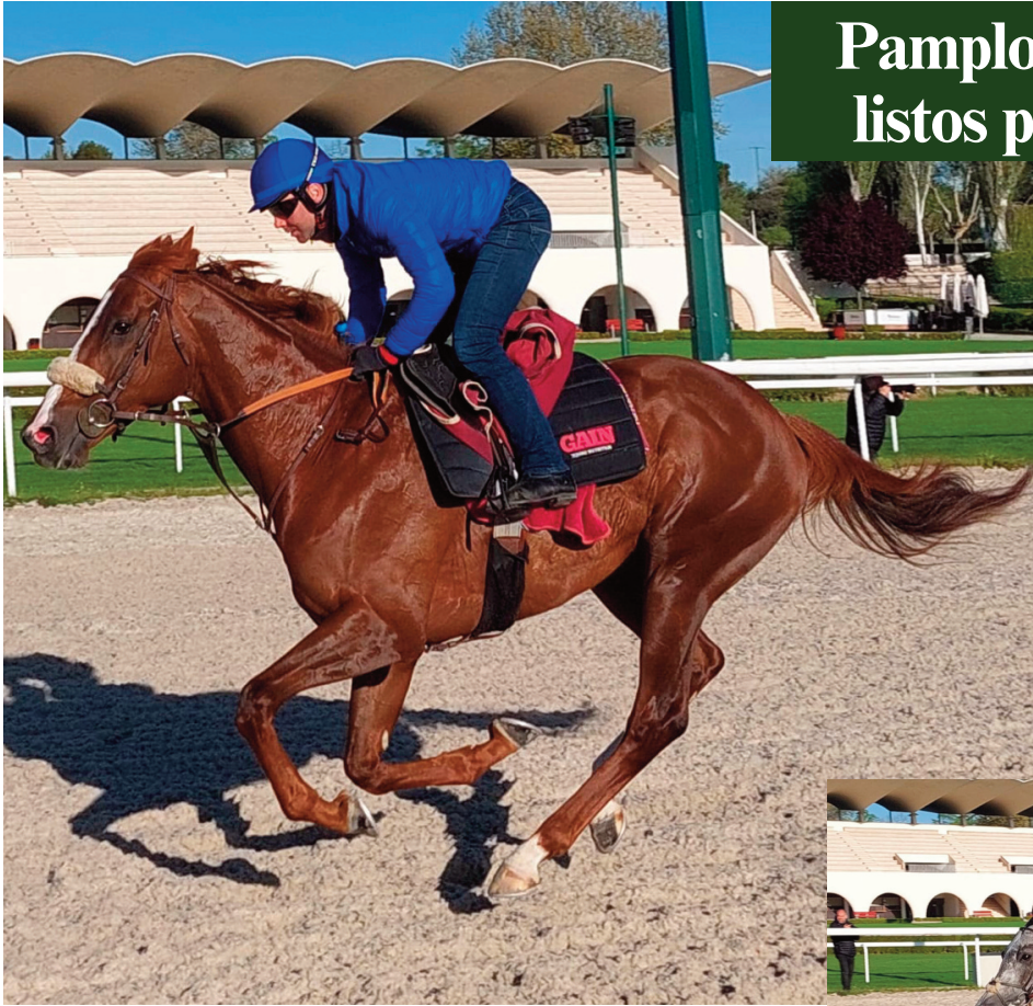
Pamplona y Janáček.