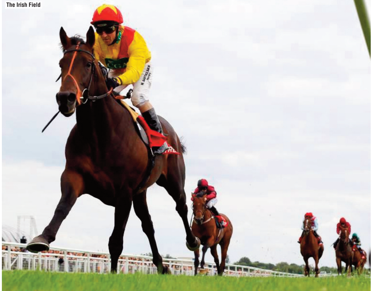
Agent Murphy, por Cape Cross, hermano de Media Storm y ganador de G3.