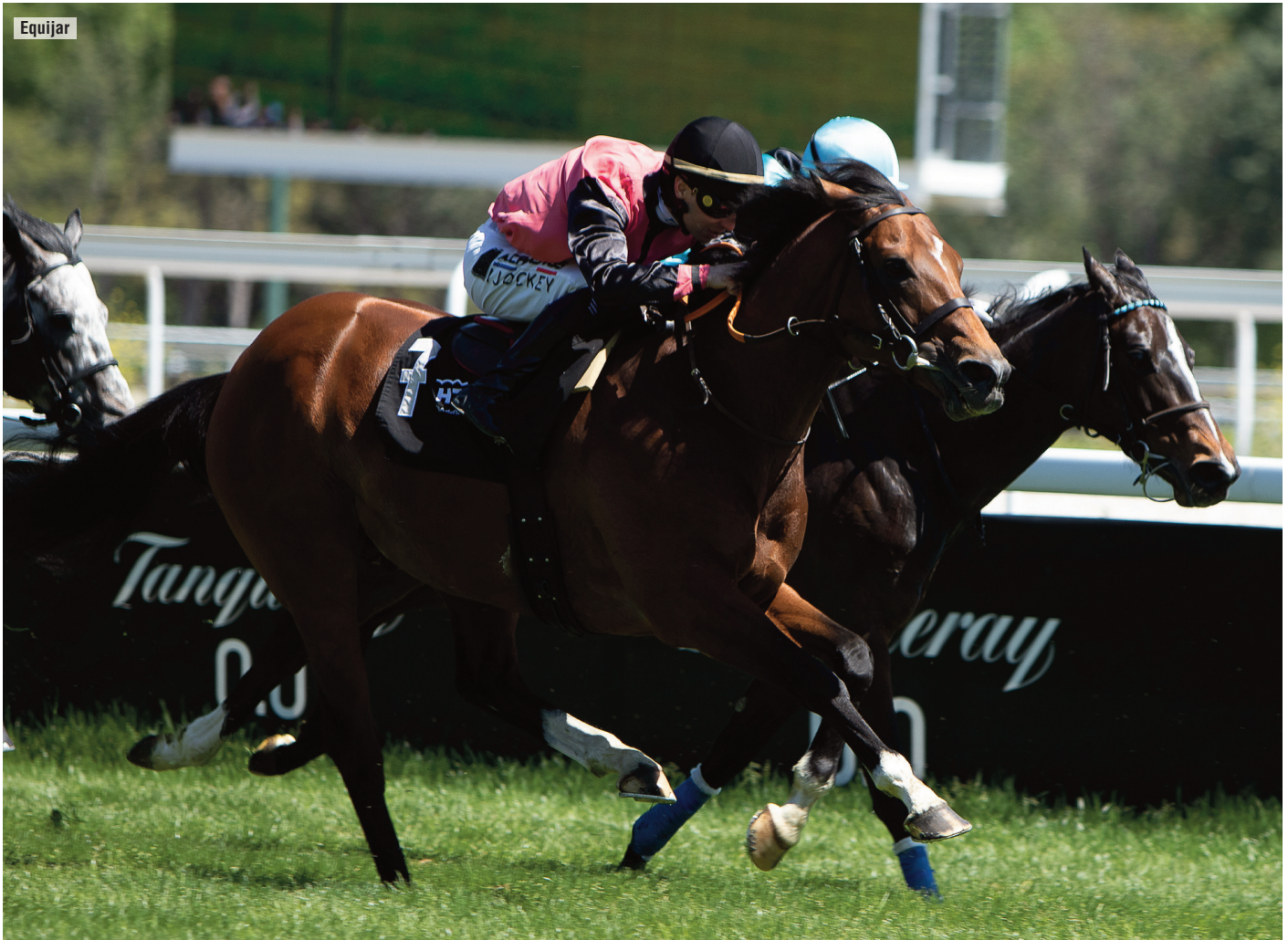
Media Storm y Safaga, la gemela del Alburquerque.