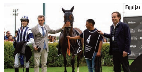
El equipo de Gimme Love tras la victoria en el Címera.