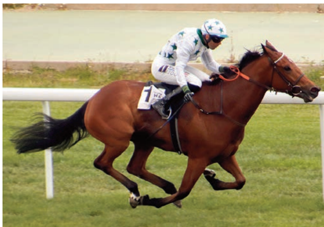
Almansa, una First Eleven de Rocío que apunta al Beamonte.

La recta de Gimme Love fue memorable. Una vez más, el Cimera fue para un rematador. Y para un rematador largo, de los que