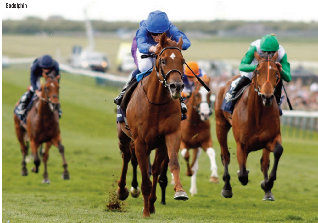
Notable Speech salió imbatido de la Poule de Potros inglesa.

El resultado de las 2.000 Guineas ha trastocado radicalmente las perspectivas para el Derby. Hasta el sábado pasado el favorito inequívoco, con cotización de alrededor de 6/4, era City of Troy . Ya no lo es. El sábado por la noche el mercado lo encabezaba a 4/1 otro Godolphin de Charlie Appleby , Arabian Crown , que es también por Dubawi y que ha ganado cuatro de sus cinco carreras, incluyendo las cuatro últimas e incluyendo, sobre todo, el Classic Trial de Sandown (G3) disputado el 26 de abril. Le sigue en cotizaciones, alrededor de 8/1, el citado Henry Longfellow , otro Dubawi , imbatido en sus tres salidas a dos años, con un Grupo 1 en su haber. Su madre es nada menos que Minding , por Galileo , lo que debería