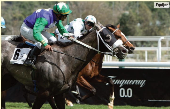
Tetuán, segundo de Trampas (6) en el Opcional, su única salida del año.