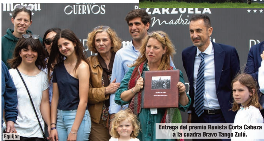
Entrega del premio Revista Corta Cabeza a la cuadra Bravo Tango Zulú.