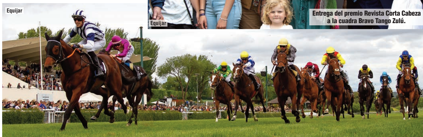
La panorámica visión de la llegada del Cimera, con Gimme Love, Seax (rosa), Spielman (gris) y X Rays (amarillo).