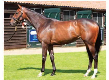
Potranca por Shalaa, de 65.000 guineas.

El preparador donostiarra contará en principio con 26 dos años para afrontar la campaña precoz después de invertir 184.000 guineas en cinco compras en la última subasta de Tattersalls . Remató a hijos de Shalaa (65.000 guineas), Galileo Gold (42.000), Zarak (50.000), Planteur (17.000) y Sandy of Gold (10.000). “Hemos buscado caballos que puedan correr pronto, no grandes de físico. Hemos tenido especialmente suerte con esta subasta en los últimos años y espero que siga así”. La ganadora del Memorial Duque de Toledo, War of Dance , fue adquirida en estas ventas.