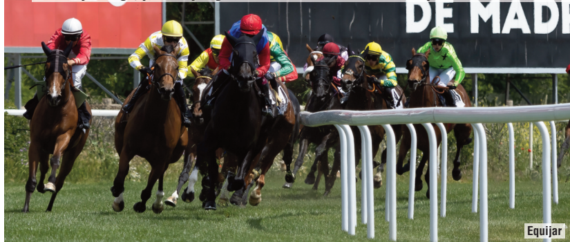
Hetera y Ruesga, primera y segunda durante todo el recorrido del premio José Luis de Salas.

“Ha salido con muchas ganas y tenía libertad para manejar el recorrido, aunque me hubiera gustado un recorrido más tranquilo para ella. Ha marcado un buen paso, ha podido respirar cuando la han dejado y gana con comodidad. Es una yegua de distancia que va a subir mucho con más experiencia”.