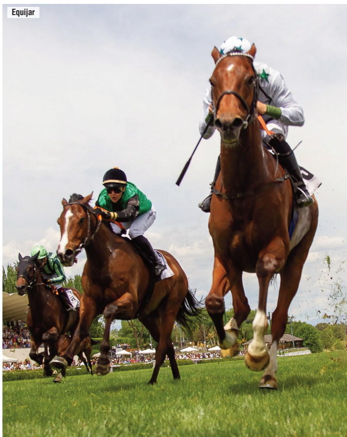
The Way of Bonnie y Ponce de León en la llegada del Corpa.

📢 Cuatro victorias de cinco montas, incluyendo las tres carreras más importantes del día. Las cifras de la jornada de Janáček lo dicen todo. Y su forma de conseguir las, mucho más.