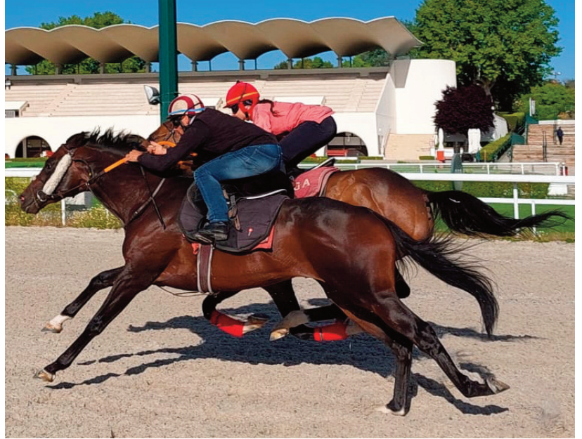
El Bosnia y Hamars, en un ejercicio en corto.