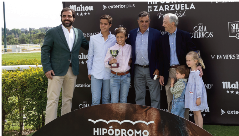
Entrega de trofeos del premio Monet para la cuadra Zurraquín, propietaria de Bragnosera.