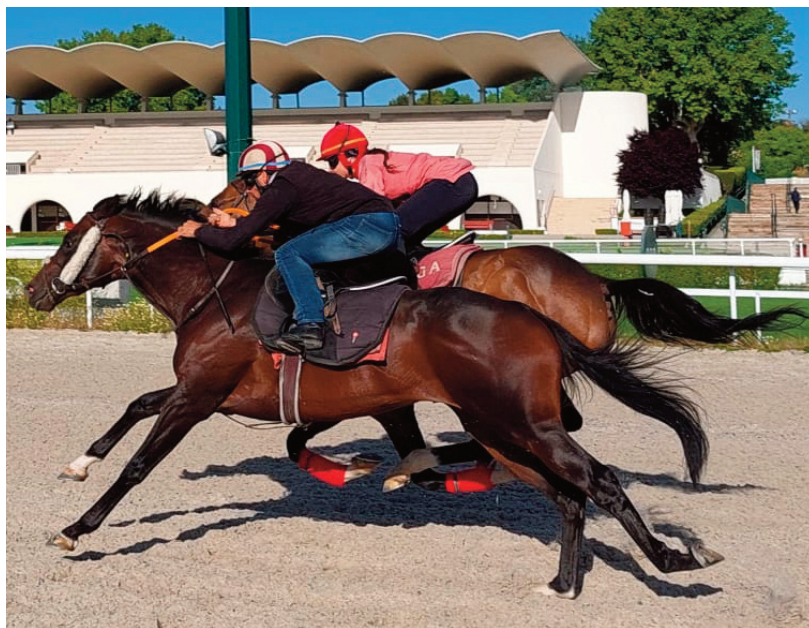
El Bosnia y Hamars, en un ejercicio en corto.