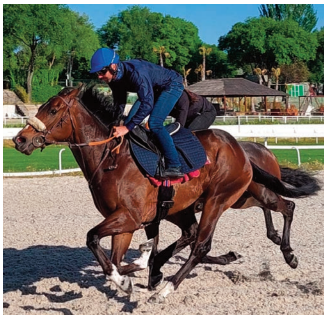
Bruno y el nuevo Baztán, que aún tendrá que esperar para debutar.