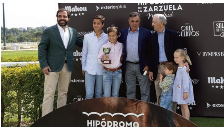
Entrega de trofeos del premio Monet para la cuadra Zurraquín, propietaria de Bragnosera.