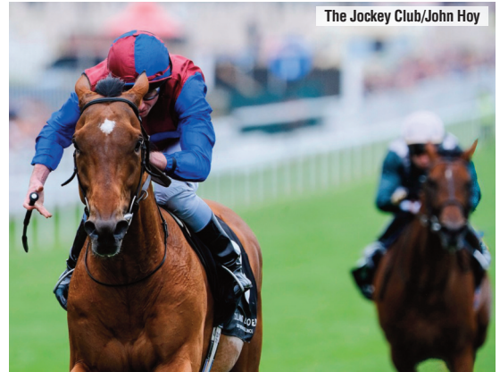
La Coronation Cup de Luxembourg.

Derby y el Oaks, una carrera que tiene su prestigio y está bien establecida en el calendario. Ahora se disputa menos de una semana después de la Tattersalls Gold Cup del Curragh, que es una carrera parecida, aunque su distancia sea 300 metros más corta. Esta coincidencia en el calendario no es buena y explica que el partant de la Coronation 2024 fuese de sólo cinco caballos. La favorita ex ante era la Gosden Emily Upjohn (Sea the Stars, 7/4), no porque tuviese una buena ca-