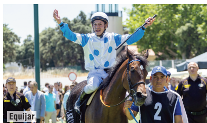
El jockey argentino sobre Caccia di Diana.

Anaya abre de nuevo hueco sobre Arizkorreta