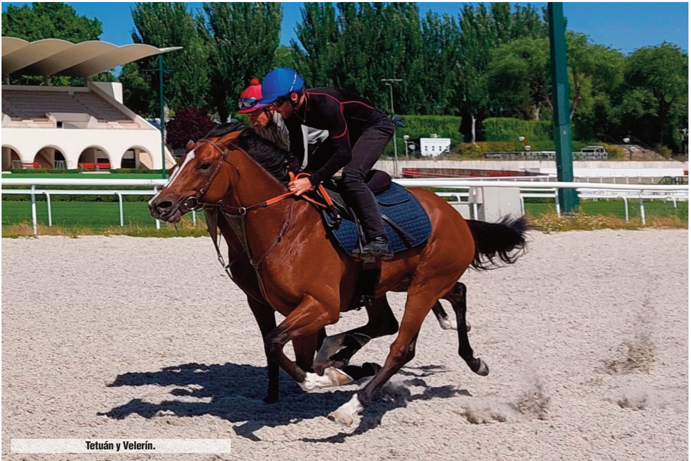
Tetuán y Velerín.