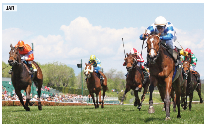
La victora en la Poule 2010, ante Premiere Vision.