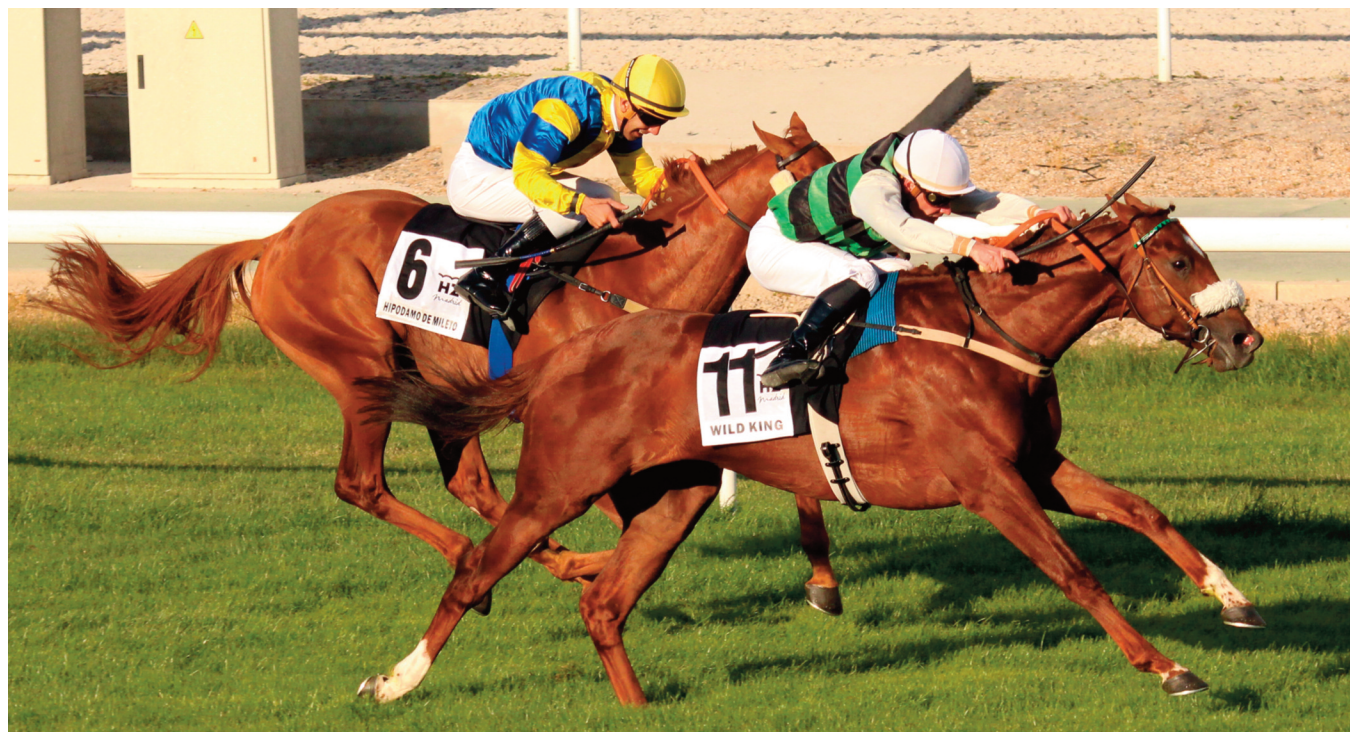
Wild King superando a Hipodamo de Mileto en el Derby 2017.