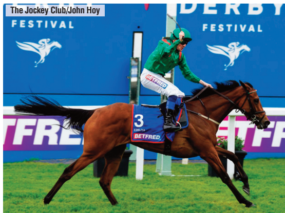
Ezeliya le devolvió la victoria a los colores del Aga Khan en un Oaks de Epsom.

El turf irlandés y el británico llevan casi tres décadas tan hegemonizados por Aidan O'Brien que a veces se nos olvida que Irlanda no sólo es tierra de grandísimos jockeys (los Eddery, Reid, Swinburn, Kinane, Fallon, etc.) sino también de grandísimos preparadores. Uno de ellos es Dermot Weld , que es, entre otras cosas, uno de los principales entrenadores del Aga Khan . No es nada extraordinario que un potro o una potranca del Aga Khan gane una clásica europea importante. Los caballos de la chaquetilla verde con hombreras rojas las han ganado en múltiples ocasiones. Pero el triunfo de Ezeliya en el Oaks de este año llama la atención por al menos dos razones: para encontrar en el Oaks un