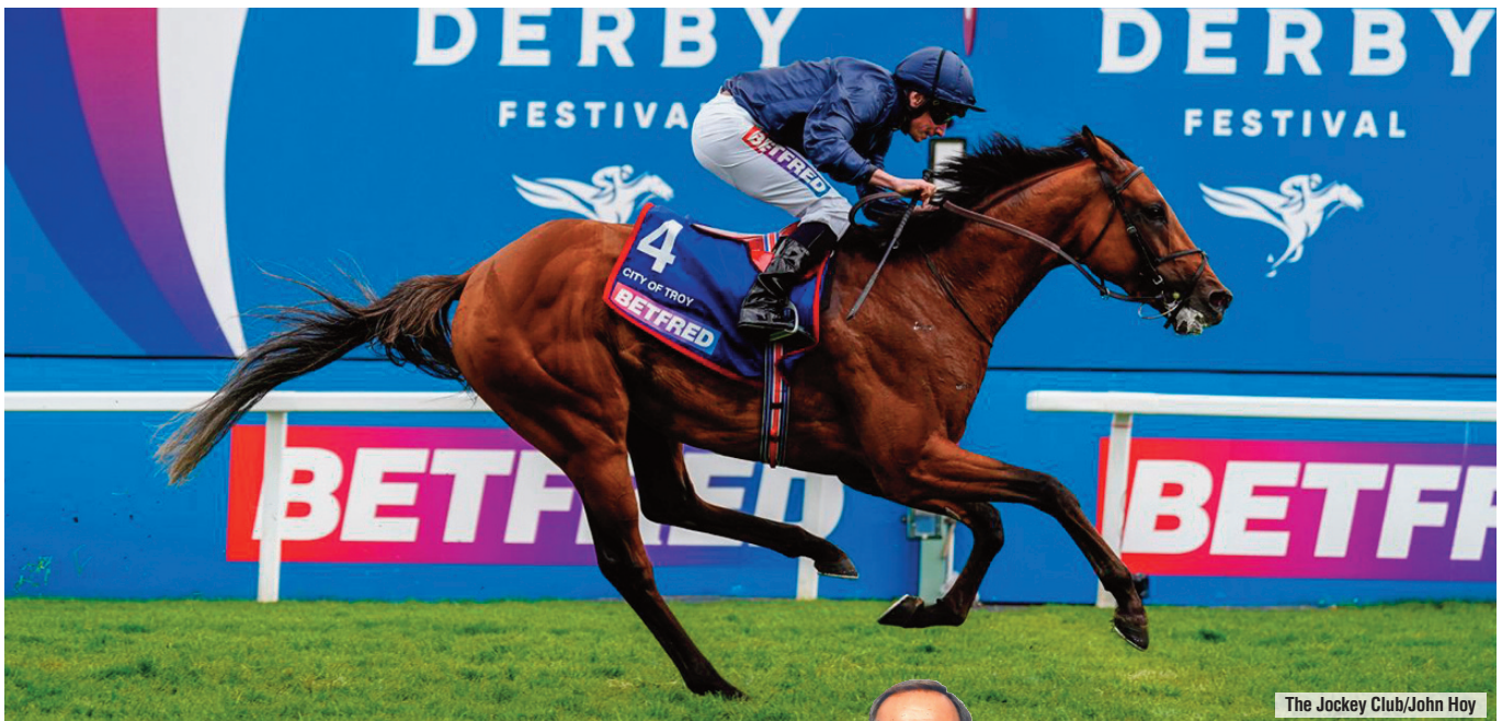
The Jockey Club/John Hoy