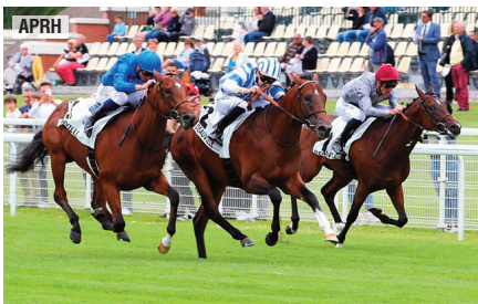
Estepona, vencedor en su debut, hijo de Marieta.