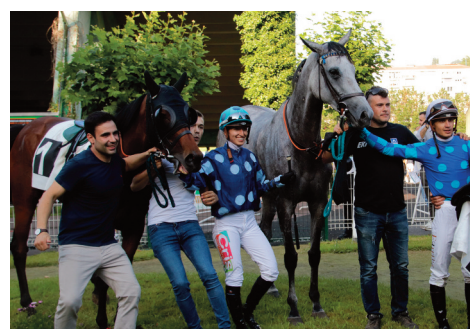
La cuadra Alegre copó la gemela del premio Hipotour con Katara y Aldufoof.