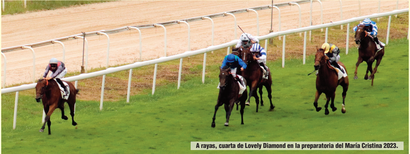
A rayas, cuarta de Lovely Diamond en la preparatoria del María Cristina 2023 .