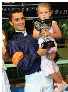
En 2005 en Mijas, hipódromo de sus últimos éxitos españoles.