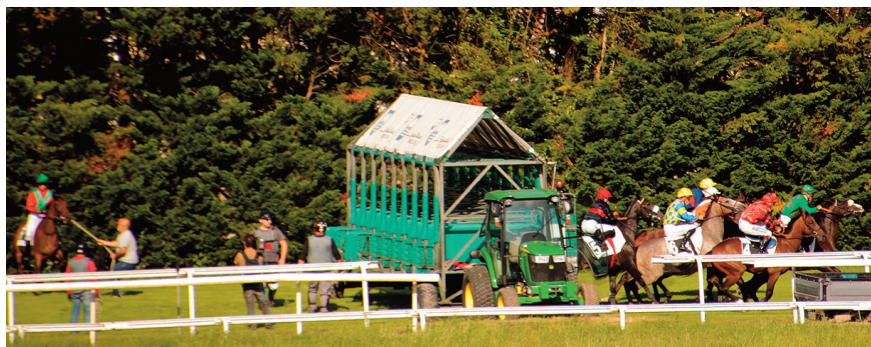
La salida del premio Hotel Viura, para debutantes, con Zorzal que no quiso entrar en el cajón.

Anexo. Se reciben certificados médicos que indican que Urbietta y Zorzal se encuentran herrados sólo de las extremidades anteriores tras las dificultades para su herraje.