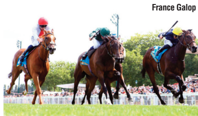
De rojiblanco, tercera de Mqse de Seigné.