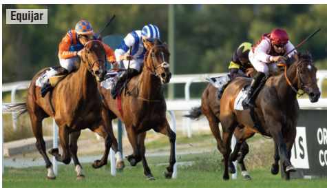
En el premio Baldoria de junio.