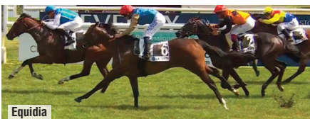
A la derecha, cuarto a dos largos.