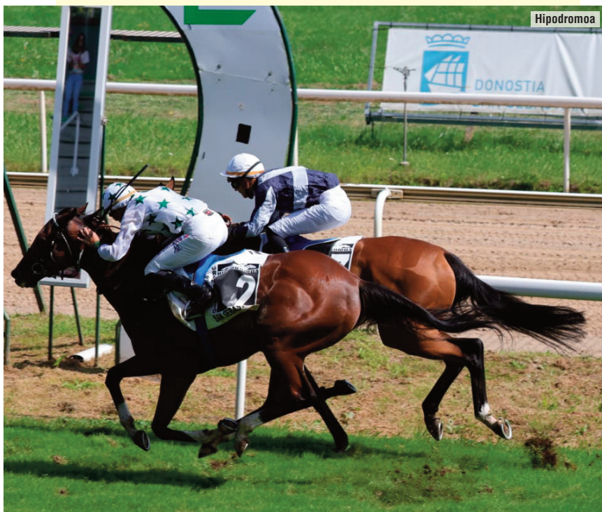
El primero de los dos triunfos del caballo de Rocío en los 2.800 metros.