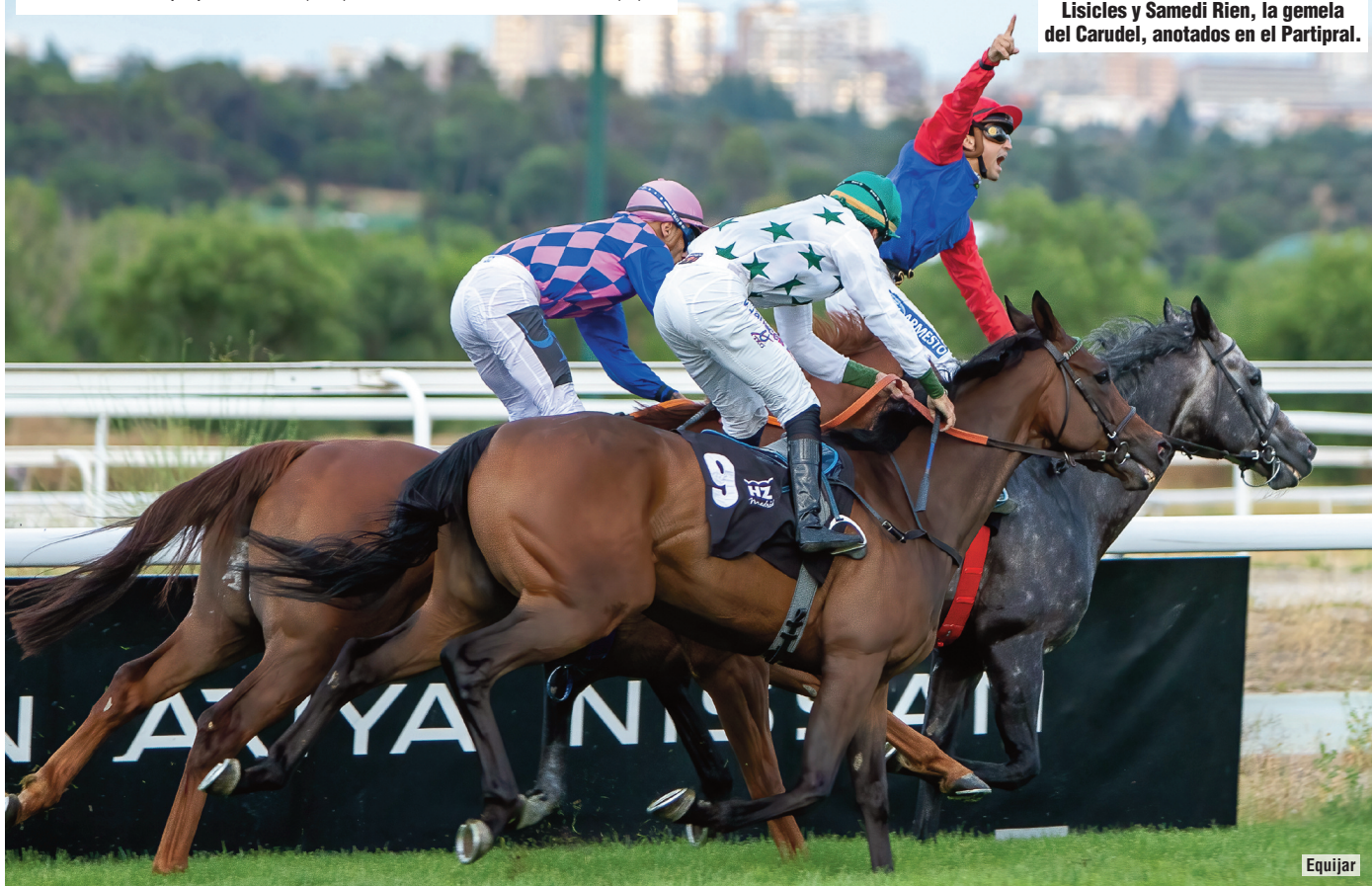
Lisicles y Samedi Rien, la gemela del Carudel, anotados en el Partipral.