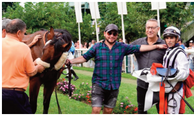
El jockey con Haya Taal, su último ganador.