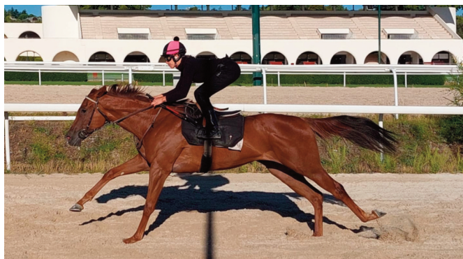
Dame Audiencia, en solitario, preparando el Sobrino.

Quiniturf • Cánter abierto de Gimme Love en solitario: 1.09.65 y 33.80. Bien. • Super Rafale trabaja serio de inicio para terminar en parciales de 1.06.33 y 33.05. Buen trabajo. • Mantenimiento de Gold Coast Galleon (Valle): 34.83. Ligero. • Por pista interior, Imonfire muestra condición: 43.36 y 32.44. Sin forzar.