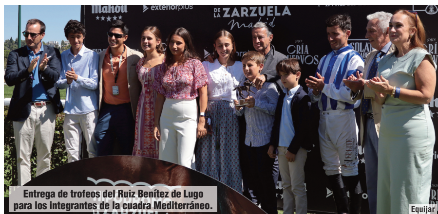
Entrega de trofeos del Ruiz Benítez de Lugo para los integrantes de la cuadra Mediterráneo.