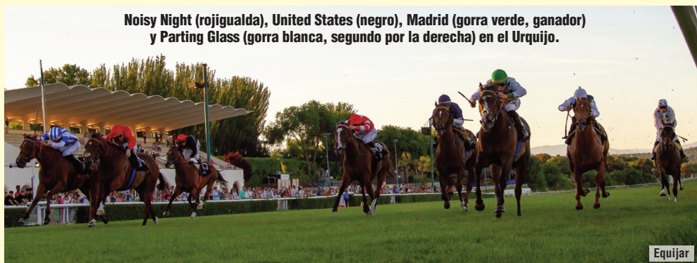
Noisy Night (rojigualda), United States (negro), Madrid (gorra verde, ganador) y Parting Glass (gorra blanca, segundo por la derecha) en el Urquijo.

La clave puede estar en los tres kilos que reciben Parting Glass y United States de Madrid y Noisy Night . El caballo entrenado por Anaya cuajó una excelente actuación en San Sebastián en un lote en el que estaban los dos primeros del Gobierno Vasco y se vio bien batido en Sanlúcar en un metraje que no es el suyo. United States falló en su última actuación de la primavera, algo extraño en él. Suele correr bien en las reapariciones. Me gustó la carrera de Madrid en Deauville, en la que entró delante de Pradaro , ganador del Grupo 3 preparatorio del Abbaye hace siete días. Ese valor le sitúa con