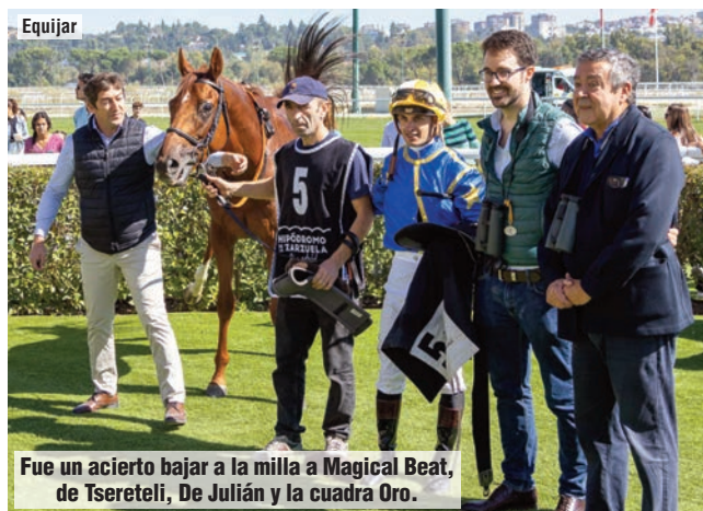
Fue un acierto bajar a la milla a Magical Beat, de Tsereteli, De Julián y la cuadra Oro.