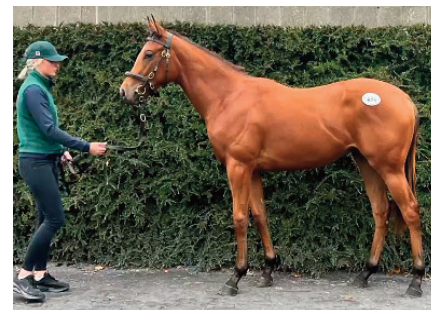
La hija de Make Believe.