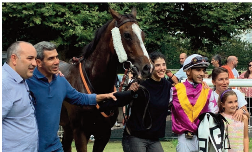
Bailén, un muy rentable producto de Lightning Moon.