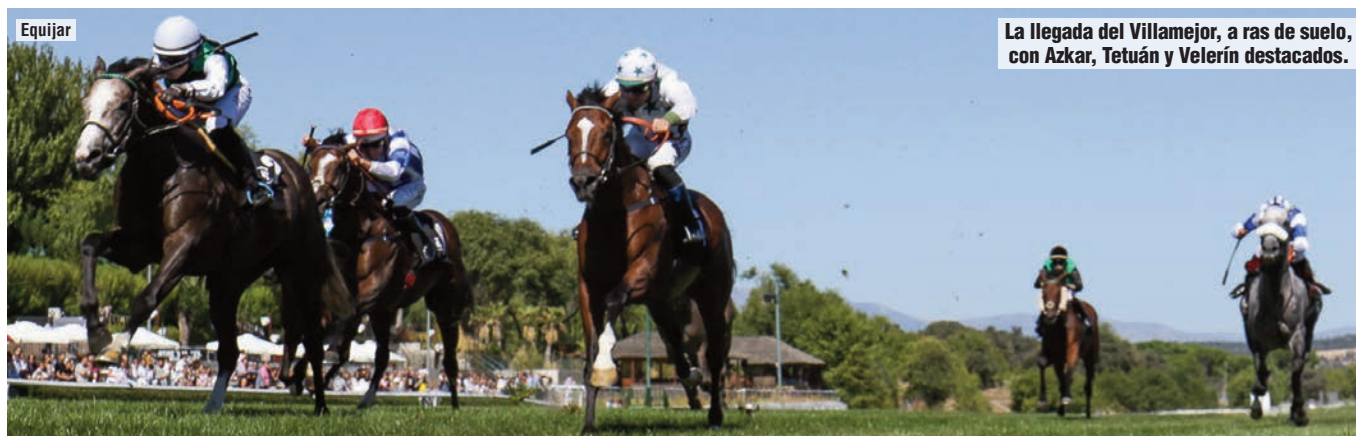
La llegada del Villamejor, a ras de suelo, con Azkar, Tetuán y Velerín destacados.