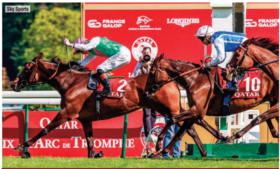
Bluestocking, ganadora del Vermeille, el reenganche de la familia Abdullah.

Viene de pasearse en el Grupo 1 alemán en el que también lo hicieron Danedream , Torquator Tasso y Alpinista , todos ellos recientes ganadores del Arco. Es un buen caballo al que hay que considerar, pero poco