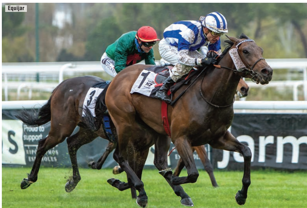
Reves de Stars en el premio Chacal del 31 de marzo, su última salida, de nuevo esperanza para 2025.

alguno más. Son siete hembras y cinco machos, una potrada bastante divertida y variada, comprados fuera o criados por nuestros propietarios. Estoy muy agradecido, se recompensa así el trabajo que hemos venido realizando con los dos años. Igual que soy muy autocrítico y me machaco mucho, también creo que en la cuadra se hace un buen trabajo con los potros. Tenemos en los últimos años la victoria de Reina Madre, dos segundos y un cuarto en el Sobrino, triunfos en el Ramón Mendoza, el Veil Picard, la Copa de Criadores, dos segundos en Listed... En general nuestros dos años debutan bien, mejoran en la segunda carrera y, al final, eso tiene mé-