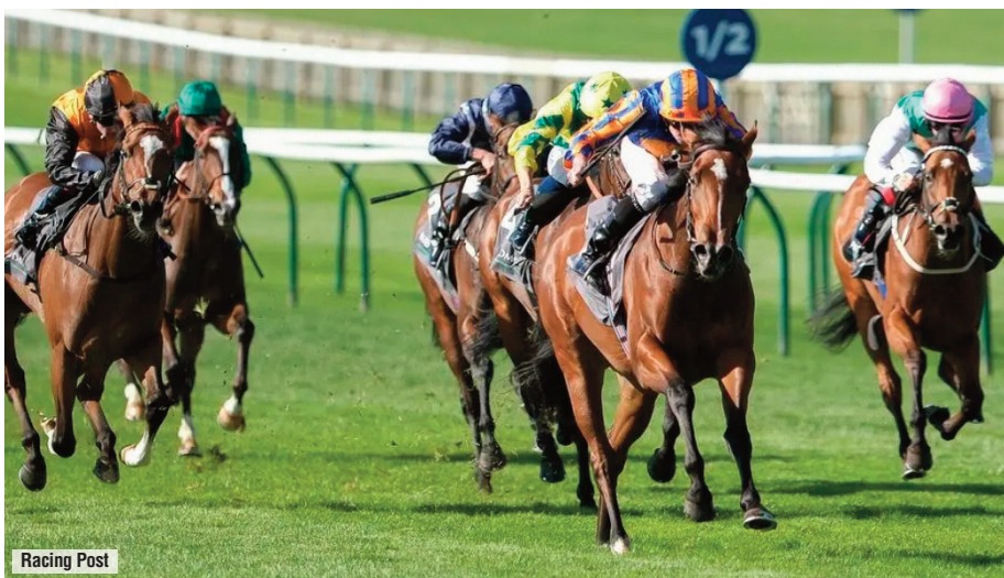
Lake Victoria en el Cheveley Park Stakes, imbatida antes del Juvenile Fillies.

La prueba cumbre de la jornada cuenta, en mi opinión, con tres fuertes candidatos a la victoria. City of Troy es el que más me gusta. Su forma de correr es buena para este hipódromo, su calidad es indis-