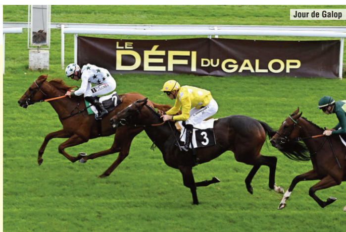
El Listed ganado por el potro de Rocío en Burdeos.