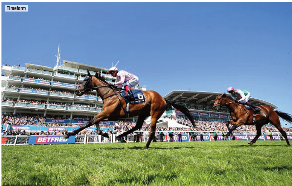
Emily Upjohn y Dettori vencieron en la Coronation Cup de 2023, ante Westover.

En la jornada del viernes 1 de noviembre se disputarán las cinco pruebas reservadas a los más jóvenes, tres de las cuales tendrán lugar en la pista de hierba y contarán con participación europea. En el Sprint cuatro de los cinco potros que aparecen igualados a la cabeza de las apuestas están entrenados en el Viejo Continente: los británicos Aesterius (Mehmas) y Big Mojo (Mohaather) y los irlandeses Ides of March (Wootton Bassett) y Whistlejacket (No Nay Never), todos ellos cotizando su victoria a 6 por 1. Si Big Mojo se hiciera con la victoria, sería la segunda consecutiva en la carrera para sus colores y el entrenador Michael Appleby . No se le debería escapar a la invicta y doble ganadora de Grupo 1 para Coolmore Lake Victoria (Frankel) la Juvenile Fillies Turf. 1,80 es lo que pagaría si confirmara su favoritismo unánime. Otra carrera muy favorable a los intereses de Europa es la Juvenile Turf, con masiva participación y en la que el potro de Godolphin ALQUDRA (No Nay Never, 7) podría dar la vuelta al resultado de su anterior enfrentamiento con New Century (Kameko, 5,50) en Canadá, pues sufrió un recorrido bastante problemático.