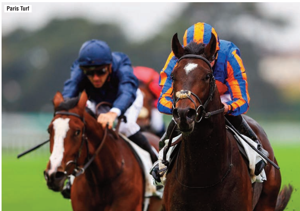
Twain, por delante de Mount Kilimanjaro, otro O'Brien.

recer en la pista. Casualmente, Wading era también el primer producto de su madre, Cherry Hinton (Green Desert), el octavo foal de la legendaria Urban Sea y uno de los tres (de sus once hijos) que no ganaron. Los otros dos ni siquiera debutaron, pero Cherry Hinton, al menos, fue segunda en Grupo 3, tercera en Listed y quinta en el Epsom Oaks (Gr1) sobre cinco salidas a la pista. En la yeguada tuvo nueve foals, de los cuales corrieron ocho, ganaron siete y seis, nada menos, fueron ejemplares de stakes , todas hembras, con cuatro ganadoras de Grupo y dos de ellas de Grupo 1: Athena (Camelot), laureada en el Belmont Invitational St. y madre de Never Ending Story (Dubawi), doble ganadora de Grupo 3; y Bracelet (Montjeu), propia hermana de Wa-