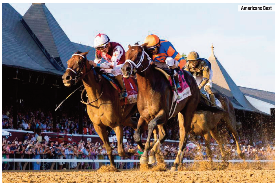
Fearness y Thorpedo Anna peleando el DraftKings Travers Stakes, que se llevó el macho.

Carrera muy pareja y de pronóstico abierto. Confío en que el ganador del Preakness, que ha vuelto por sus fueros en el