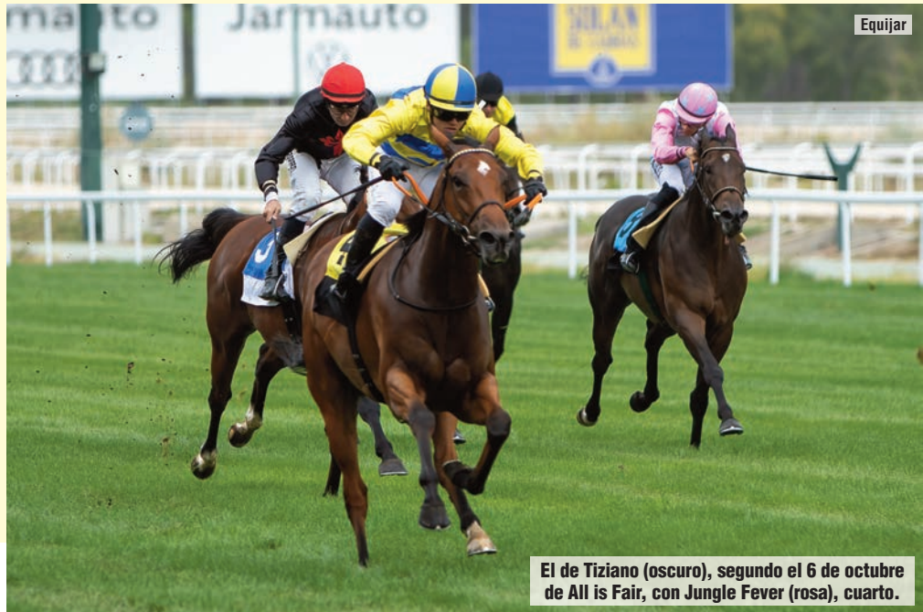
El de Tiziano (oscuro), segundo el 6 de octubre de All is Fair, con Jungle Fever (rosa), cuarto.

Selección: Jungle Fever Alternativa: United States