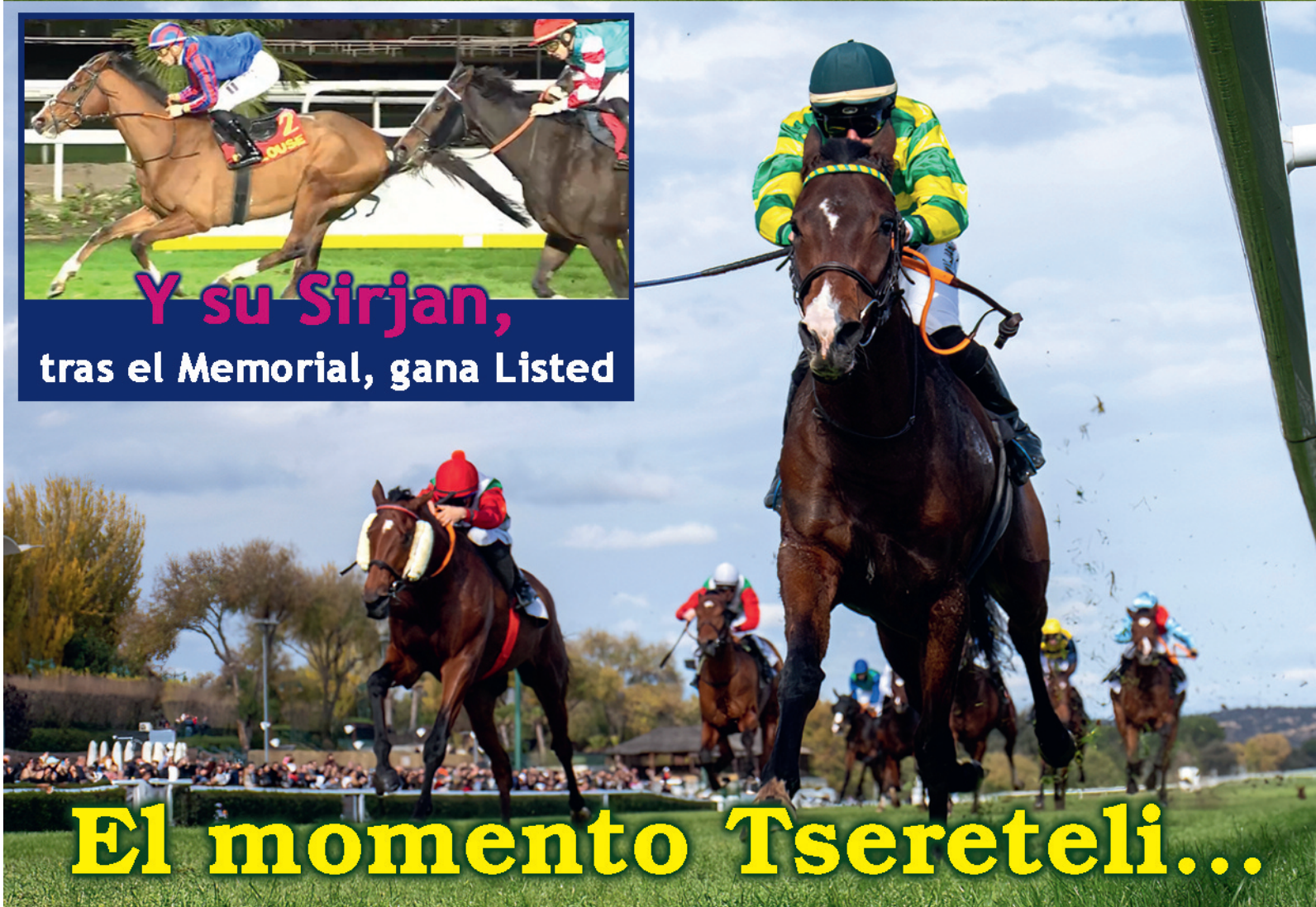
El momento Tsereteli...