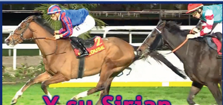
Y su Sirjan, tras el Memorial, gana Listed