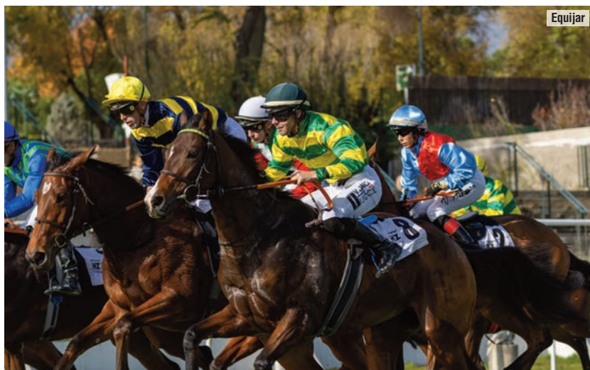
Sweet Caroline, delante desde la salida.

Heliópolis llegó a España tras haber dado un valor 41 en Francia y haber ganado siete carreras, seis de ellas en 2.400 metros o más. Que fuera comprada para correr el María Cristina no quiere decir que ese fuera su mejor objetivo.