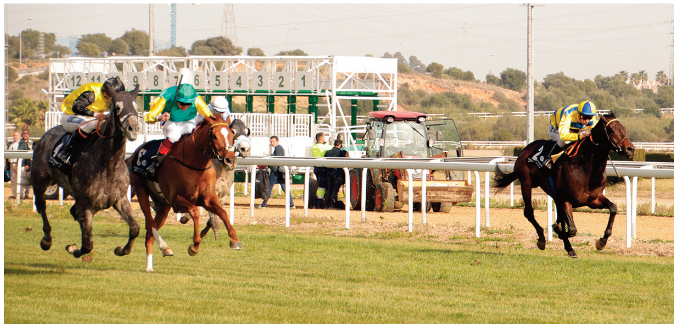
El viejo mantra de que la temporada invernal es para caballos modestos debe quedar superado.

Abundo en el hito número tres. El Javier Piñar Hafner se encuentra en el momento más propicio de su historia para convertirse en aquello para lo que fue pensado a finales del siglo pasado. Sus instalaciones y sus pistas están mejor cuidadas y mantenidas que nunca, pero, sobre todo, mejor rodeadas y acompañadas. Su contexto poblacional, demográfico, social y económico ha cambiado radicalmente. Antes se encontraba en mitad de la nada, y hoy tiene alrededor un foco de actividad fantástico y creciente que el Ayuntamiento nazareno ha ido generando con una gran visión de futuro. Ade-