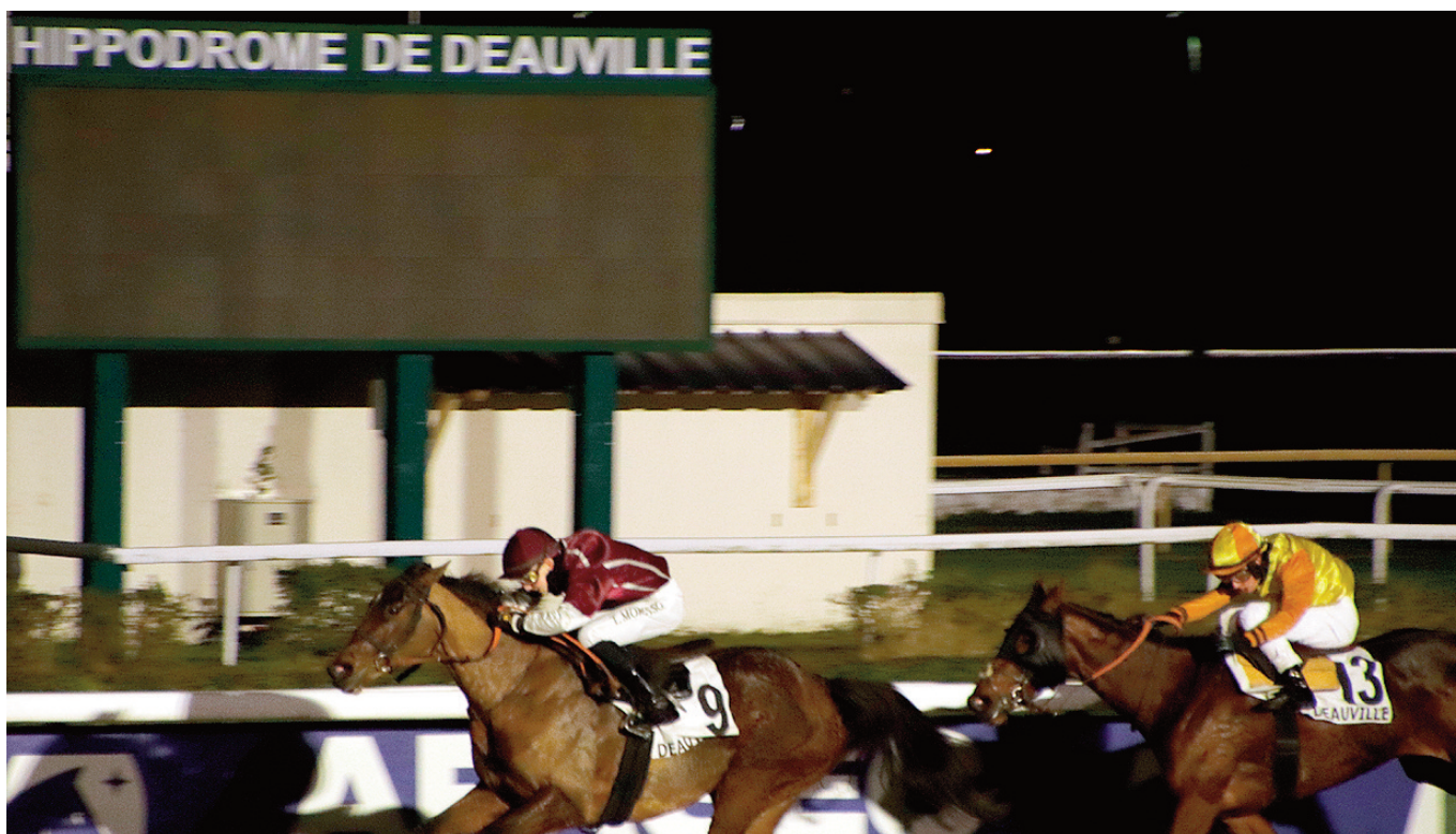
Si en Deauville hay muchas carreras en el frío mes de diciembre, también las puede haber en Madrid.

del PSI a través de acciones como la optimización del rendimiento del centro de entrenamiento, la mejora y la planificación del calendario de jornadas de carreras, el desarrollo y expansión de las apuestas internas, externas e internacionales (sic), y la captación de nuevos patrocinadores que impulsen la actividad del recinto." La música suena bien, aunque la verdadera cuestión de interés es cómo se va a hacer esto: con qué inversiones, criterios, plazos, objetivos concretos, KPIs, puntos de control, etcétera. Y, también, si hay alguna previsión de acción para el caso de que los resultados no sean los esperados. Sea como sea, y es a lo que iba, lo que no admite duda es que haciendo lo mismo seguirá pasando lo mismo. En el invierno, en Dos Hermanas, en Madrid... y en el conjunto de las carreras. No se trata de atreverse a salir de la zona