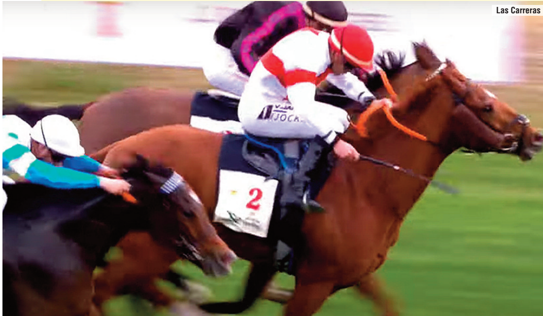
El de Pazooki (izquierda), tercero de Magical Beat y Nathan en diciembre.