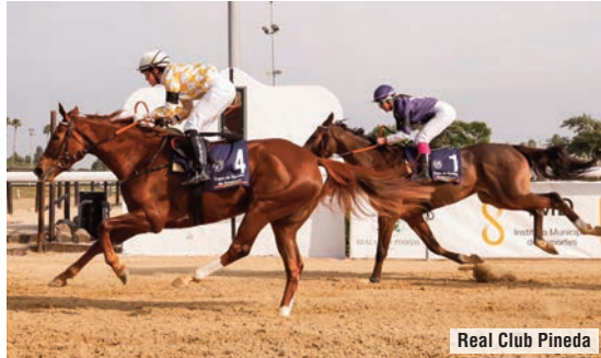
Real Club Pineda

“El recorrido ha salido perfecto para que la yegua pudiera dar su mejor versión. Gana muy bien. La pista le ha ayudado, le gusta la arena y además es ágil, lo que le beneficia mucho en este hipódromo”.