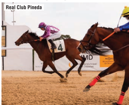
Real Club Pineda

“Se ha corrido rápido y me ha dado un poco de miedo ir detrás, pero es un caballo que dobla muy bien y es muy luchador. Creía que le iba a costar más, pero en dos trancos los ha pasado por encima”.