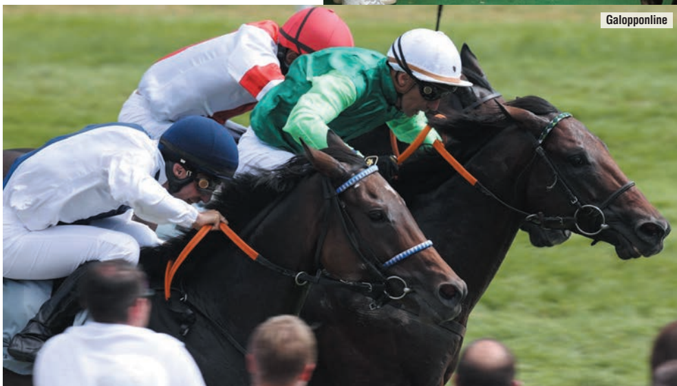
Su ganador de Grupo 2 Rodaballo en Baden Baden.

La recogida más ilusionante, la Copa de Oro de The Way of Bonnie, en el verano 2021, aún con pandemia.