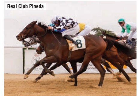
Real Club Pineda

“Le ha costado arrancar y ha tenido un recorrido progresivo. Ha entrado en la recta lanzado como queríamos, aunque un poco abierto, pero ha luchado hasta el final”.