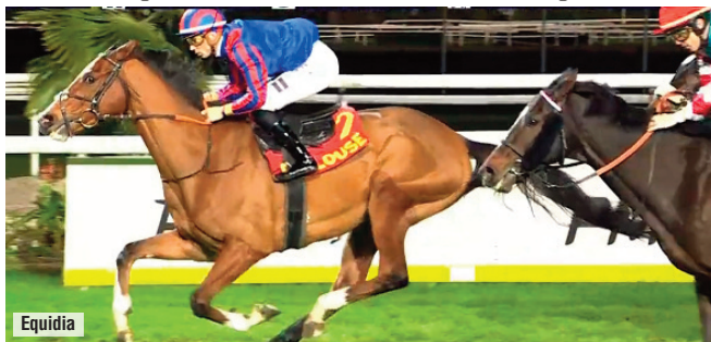
Sirjan en Toulouse

La cosecha española en el extranjero durante el año pasado en carreras black-type fue más productiva en victorias que en colocaciones mayores. Bulnes y Sirjan ganaron el Critérium de Burdeos y el Max Sicard (ambos Listed), pero Clori , Samedi Rien y Alpha Wonder se tuvieron que consolar con la cuarta plaza en Listed, a una cabeza de la negrita. El ganador del Memorial Duque de Toledo fue valorado en France Galop con 46 por su triunfo en Toulouse. En el Jockey Club figura sin valor al haber disputado sólo dos carreras en nuestro país.