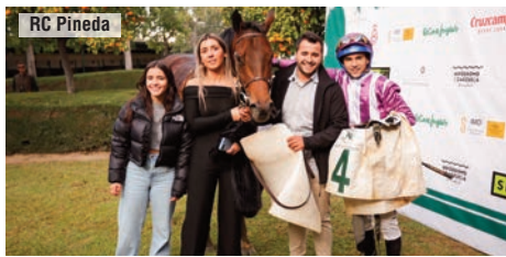
Con el equipo de Piguinha y Muguetajarra.