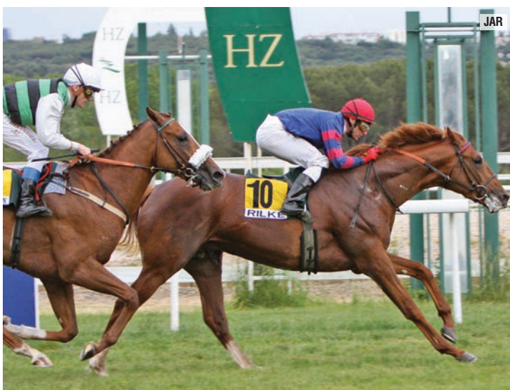
Uno de sus cuatro Villapadierna-Derby, siempre con nacionales, en este caso Rilke.

Son triunfos recogidos en hasta 38 hipódromos de seis países diferentes: España, Francia, Alemania, Emiratos, Marruecos y Suiza. Quizá le pueda faltar la muesca inglesa. “La experiencia de acudir a Inglaterra hace un par de años estuvo bien y me gustaría volver a participar allí, pero lo que me atrae es competir lo máximo posible en el extranjero, sea el país que sea, y sobre todo en las carreras de mayor nivel”.