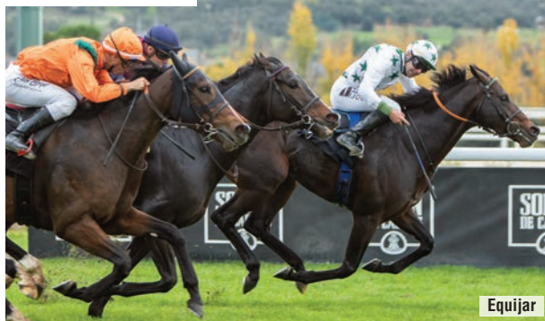
El trío del Memorial, Naranco (48), Kowalsky (44) y War of Dance (44,5).

Su compañera de sedas en Rocio , y congénere (ambos nacieron en 2019), Samedi Rien (Bated Breath) repite también en el segundo escalón en la tabla. Mejor yegua y millera, se impuso en cinco carreras (con su triplete histórico en el Hispanidad incluido) y sumó