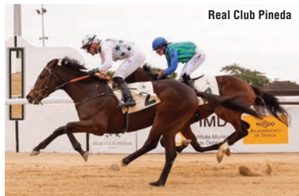
Real Club Pineda

“En el debut salió último y acabó último y no esperaba su victoria, en los trabajos demuestra poco, aunque en la última semana había mejorado algo. Janáček la he montado con mucha fe, ha demostrado que tiene distancia y algo de calidad”.