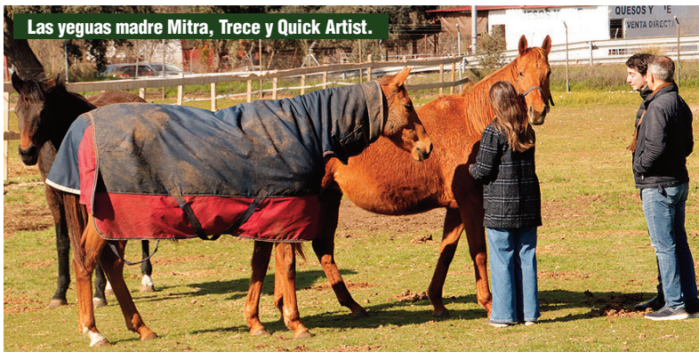
Las yeguas madre Mitra, Trece y Quick Artist.

2024), Habanero , Heliópolis , “ que se puso como una bestia de fuerte ”. Caballos que salen al prado todos los días y al caminador el tiempo que solicite su preparador. “ En general todos precisan de un pequeño tiempo de aclimatación, pero luego se marchan como perritos, contentos y gordos ”.