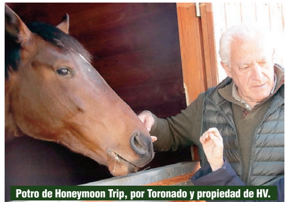
Potro de Honeymoon Trip, por Toronado y propiedad de HV.