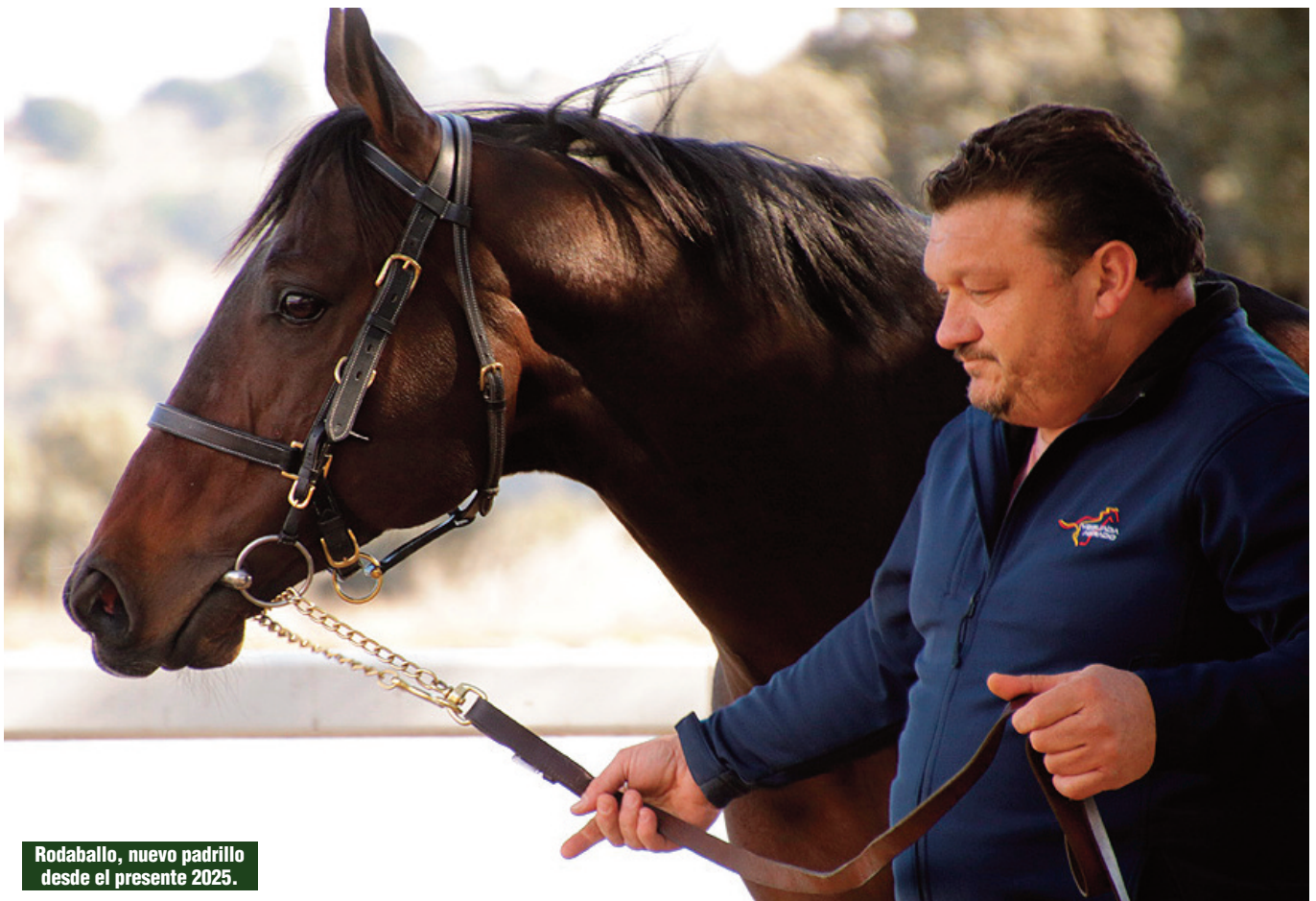
Rodaballo, nuevo padrillo desde el presente 2025.