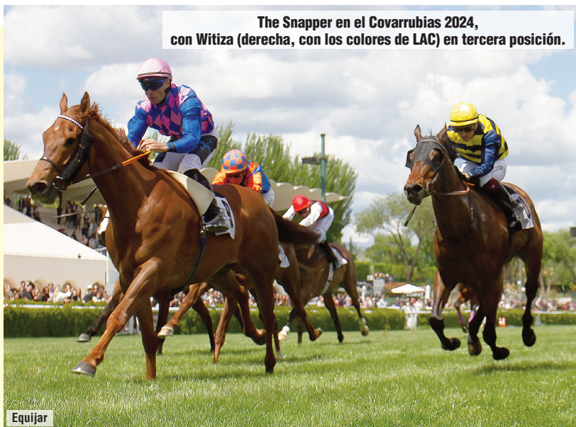
The Snapper en el Covarrubias 2024, con Witiza (derecha, con los colores de LAC) en tercera posición.