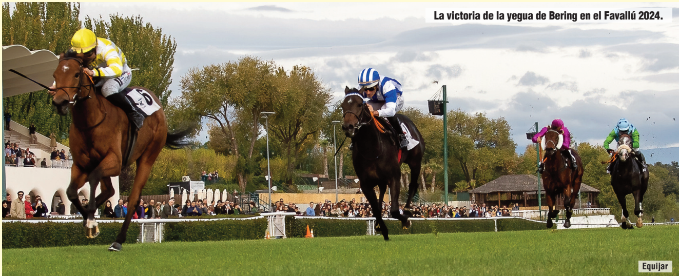
La victoria de la yegua de Bering en el Favallú 2024.

Selección: Alpha Wonder Alternativas: Goodmood - Fred on Fire