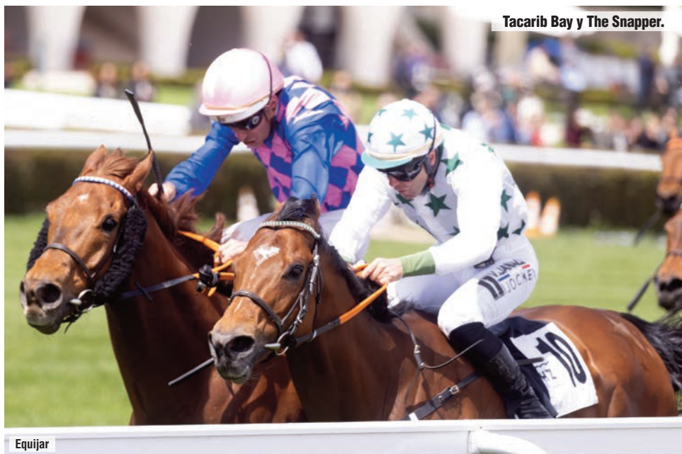
Tacarib Bay y The Snapper.