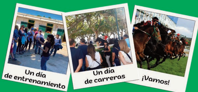
Un día de entrenamiento