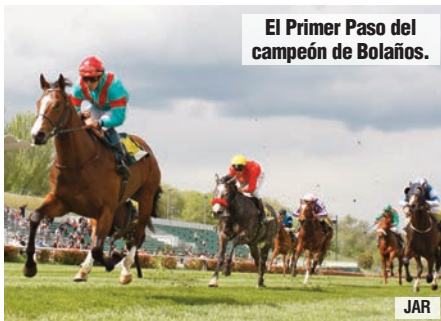
El Primer Paso del campeón de Bolaños.

La sangre del campeón de sementales está doblemente representada entre los diez matriculados en el Primer Paso, carrera en la que se impuso en su día. Por un lado, cuenta con Arzúa , la primera corredora de Ategorrieta (Gran Critérium y Gran Premio Subasta), de la yeguada Rocío , y, por otro, tiene a Califa , un hijo de Dandy Man y de su hermana maiden La Perla (Sinndar), propiedad de la cuadra Campo Real y entrenado por Álvaro Soto y que fue presentado en la subasta de criadores.