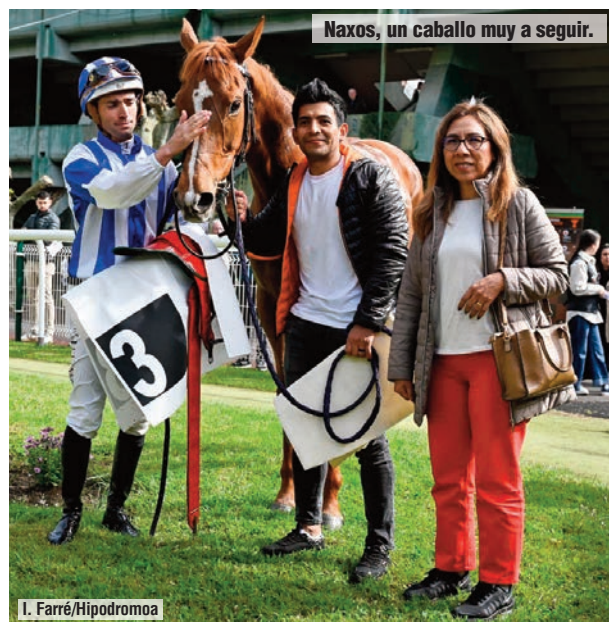
Naxos, un caballo muy a seguir.