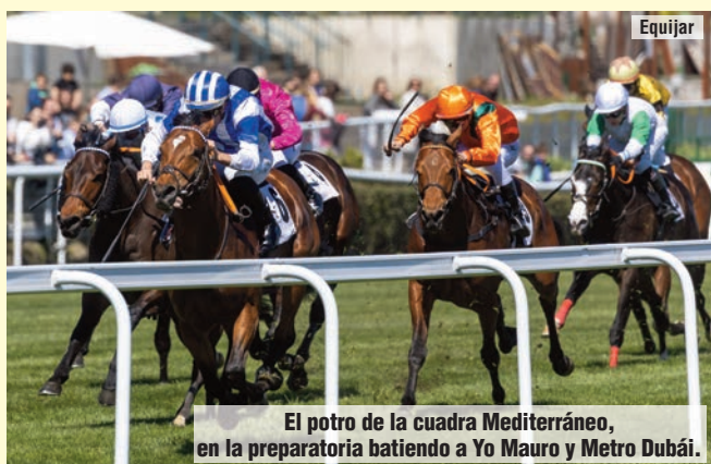
El potro de la cuadra Mediterráneo, en la preparatoria batiendo a Yo Mauro y Metro Dubái.