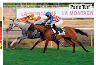
Su victoria del campeonato en Vichy.

“A diferencia de otros años, esta edición ha sido más corta, comenzó más tarde y ha estado más concentrada. Afortunadamente, he contado con caballos con buenas probabilidades durante todo el campeonato en una edición con jinetes nuevos, con mucha energía y con ganas de crecer. Las victorias en San Sebastián y Vichy me ayudaron mucho. Como cuando gané hace diez años, hasta la última carrera no había nada decidido y todo ha sido muy intenso hasta el final. Debo agradecer a la AEGRI, a todos mis compañeros de la cuadra y a mi familia el apoyo recibido”.